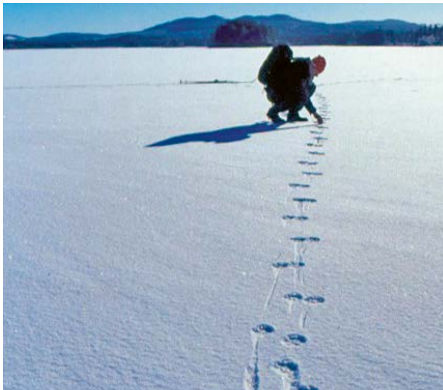
Vargspårning i Leksandsreviret vid Säxen, februari 2002.

ca hälften av älgindividerna är det. Vargarna väljer framförallt unga och gamla älgar. Jaktframgången styrs troligen också av miljön, där vissa områden är mer fördelaktiga för vargen att lyckas med sina attacker medan andra områden är mer fördelaktiga för bytesdjuret för att undkomma dessa attacker. Skillnader i tillgänglighet av bytesdjur, både beroende på art och miljörelaterad jaktframgång, kan då eventuellt förklara en del av de globala skillnaderna i vargens revirstorlek.