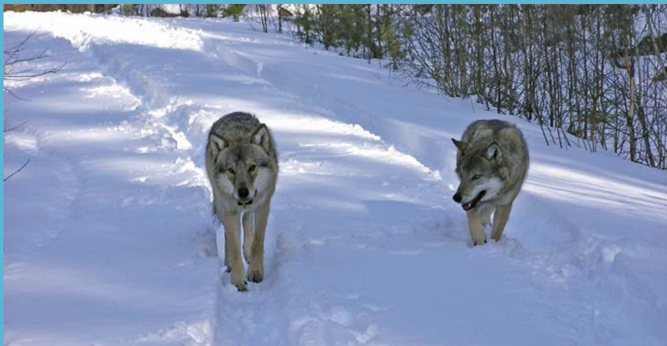
Alfapar vid Amungen.

■ Hur stora hemområden olika arter utnyttjar för sina behov kan variera från några få kvadratmeter för små arter, till många tusen kvadratkilometer för större djur. Även inom arter förekommer en betydande variation i hur stora områden olika individer använder. Denna variation i områdesutnyttjande är kopplad både till ekologiska faktorer såsom livsmiljöns beskaffenhet och till sociala faktorer. Exempel på faktorer i miljön kan vara bördighet och typ av växtlighet. Exempel på sociala faktorer kan