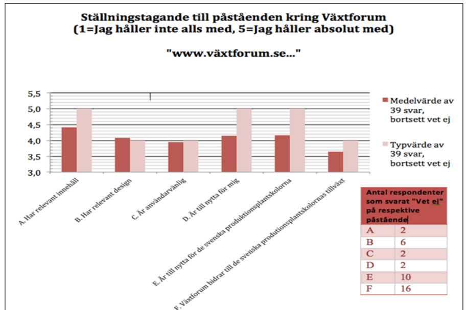
Diagram 1. Respondenternas ställningstaganden till respektive påståenden om www.vaxtforum.se .

ra första träffarna vid en Google-sökning på något av sökorden "plantskola", "plantskolor", "växtskötsel", "växtvård" eller "växtskydd". Att utveckla Växtfo-rums förstasidestext med mer välvalda nyckelord borde rimligtvis öka träffsä-kerheten och göra det lättare för gemene man att hitta till hemsidan.