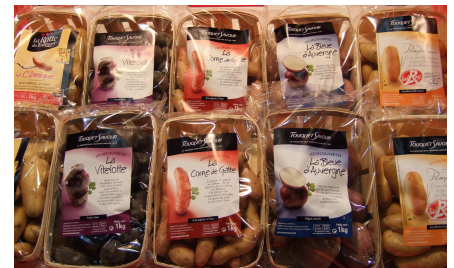
Exempel på konsumentförpackningar.

Utifrån detta är rekommendationen att potatisbranschen, för att öka konkurrenskraften, bör kunna fortsätta att utveckla mer differentierade produkter med mer bekvämlighetsprägel. Förpackningar är i detta avseende ett bra sätt att skilja produkten från den bulkvara (potatis i lösvikt) som associeras som obekvämt. Tvättade produkter, tunna skal, jämna storlekar och felfria produkter i övrigt förefaller också vara rekommendationer som kan hjälpa produkten att bli bekvämare för konsumenten. Det finns dock flera aspekter som behöver undersökas närmare, det gäller inte minst hälsoaspekten och andra trender som påverkar konsumenternas val.