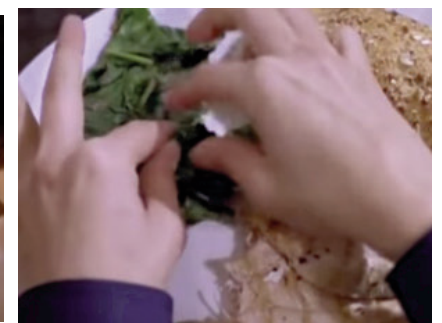
Foto 9. Manipulación de la comida.

Fisioterapia...) como para adolescentes del mundo del deporte, como método de prevención y visualización de los TCA.