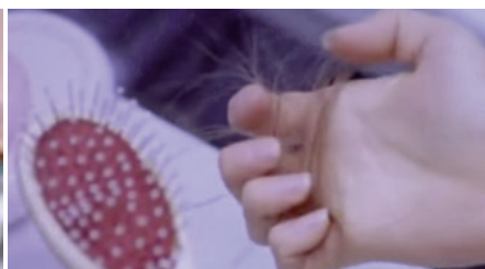
Foto 6. Caída de cabello.