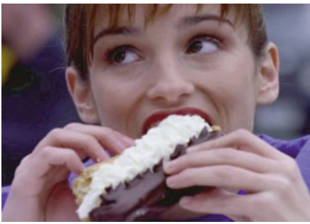
Foto 1. Ingestión compulsiva.