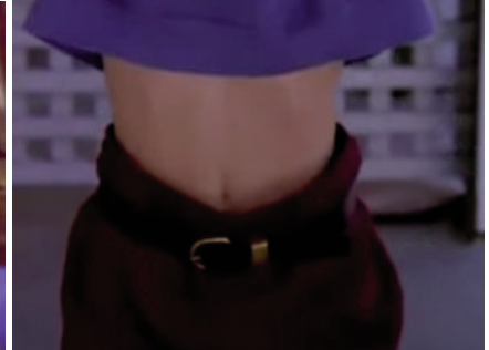
Foto 3. Pérdida de peso excesivo.