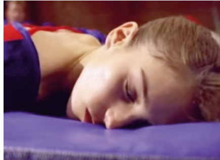
Foto 2. Cansancio extremo.