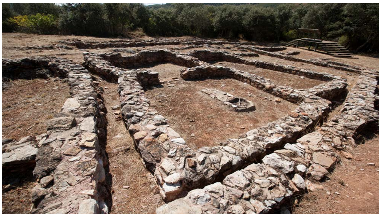
Asentamiento metalúrgico de Orellán.

Sin embargo, no adelantemos el discurso porque antes de llegar a producirse un consenso tácito sobre el instrumento de gestión, no es menos cierto que, en paralelo, se ha atravesado un camino de construcción jurídica que ha tenido por objeto el paraje de las Médulas y que ha ido incorporando normativa general y específica durante las dos últimas décadas. Este armazón legal que sobre las Médulas se ha realizado para dotar al Espacio Cultural y Natural de las herramientas jurídicas a partir de las cuales se puedan implementar instrumentos de gestión, tuvo como antecedente la Declaración como Monumento Nacional de Las Médulas en 1931 y como Bien de Interés Cultural (BIC) en cuanto Zona Arqueológica en 1996. Tras la Declaración como Patrimonio Mundial, al ya BIC le alcanzó la protección de la Ley 12/2002, de 11 de julio, de Patrimonio Cultural de Castilla y León. El desarrollo de los establecido en esta importante Ley tuvo un primer hito reseñable en el