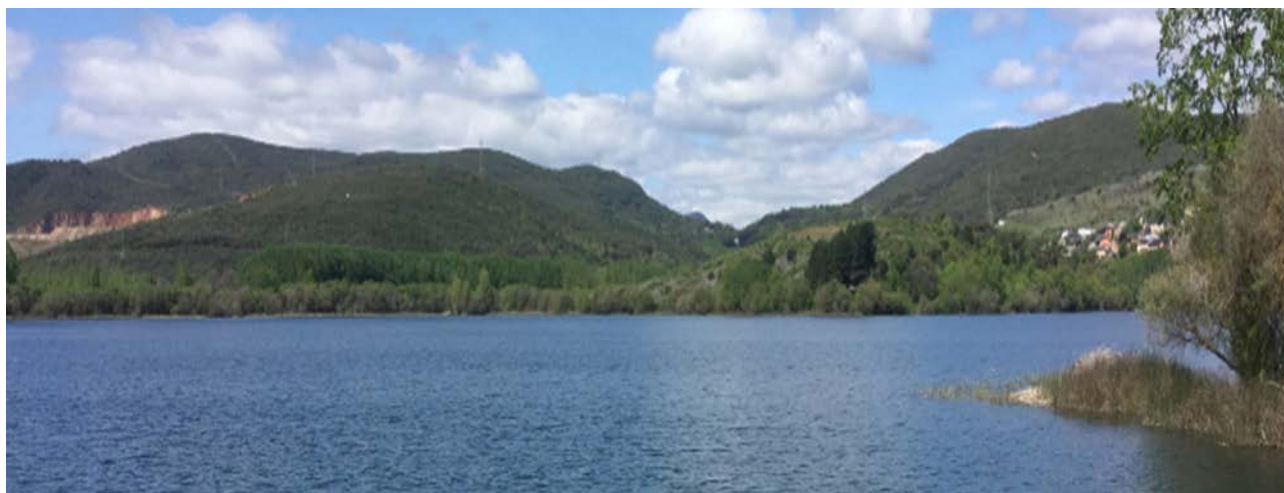
Lago de Carucedo.

Desde aquellos trabajos de referencia sobre Las Médulas, el interés científico sobre las mismas no ha cesado. Siendo un territorio que debe ser comprendido en su totalidad como una unidad, se ha continuado trabajando, bien es cierto que desde las oscilaciones y quebrantos que los recursos públicos destinados a la investigación científica han padecido en España. Así, además de la propia comprensión de la explotación minera y sus derivadas, se han abierto líneas de investigación desde ángulos tan diversos como los relativos a la flora de la zona (Romero y Ron, 2014) o el medioambiente (Cerdeira, 1986), los que han tenido que ver con la geología (Pérez García, 1992), el poblamiento y sus transformaciones (Sastre, 1998 y 2001), las infraestructuras hidráulicas (Matías, 2006, 2006-2007, 2008), la toponimia (Bello Garnelo, 2001) y también los que han incidido en aspectos patrimoniales (Fernández Posse et alii, 2002), sociales (Martínez Quintana 2014) o han puesto directamente el acento en la gestión y en los aspectos conceptuales (Ruiz Del Árbol y Sánchez Palencia, 2007, Lage Reis, 2012, Escuredo, 2014). Este indiciario repaso muestra la gran versatilidad de las Médulas como recurso patrimonial y, a la vez, pone de manifiesto la necesidad de avanzar en perspectivas complementarias a la estrictamente arqueológica que doten de mayores y mejores herramientas con las que acometer la gestión integral del Espacio Cultural y Natural de Las Médulas como unidad patrimonial.