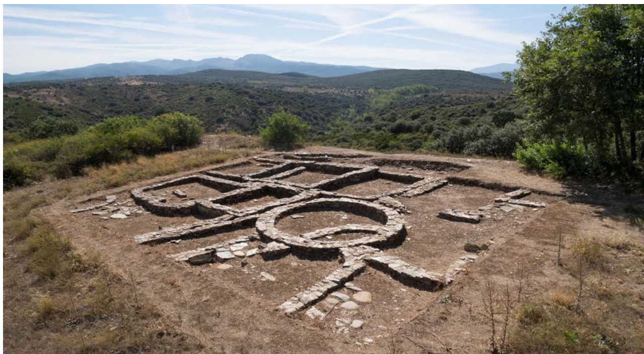
Castrelin de San Juan de Paluezas.

tengan una misma finalidad, etc. Por su parte, define el adjetivo, única como algo solo y sin otro de su especie, singular. Por tanto, unificar precisa un elemento previo, en este caso, el hecho de que existen gestiones diversas que se unen para formar una organización, mientras que la gestión sea única no exige ese elemento previo.