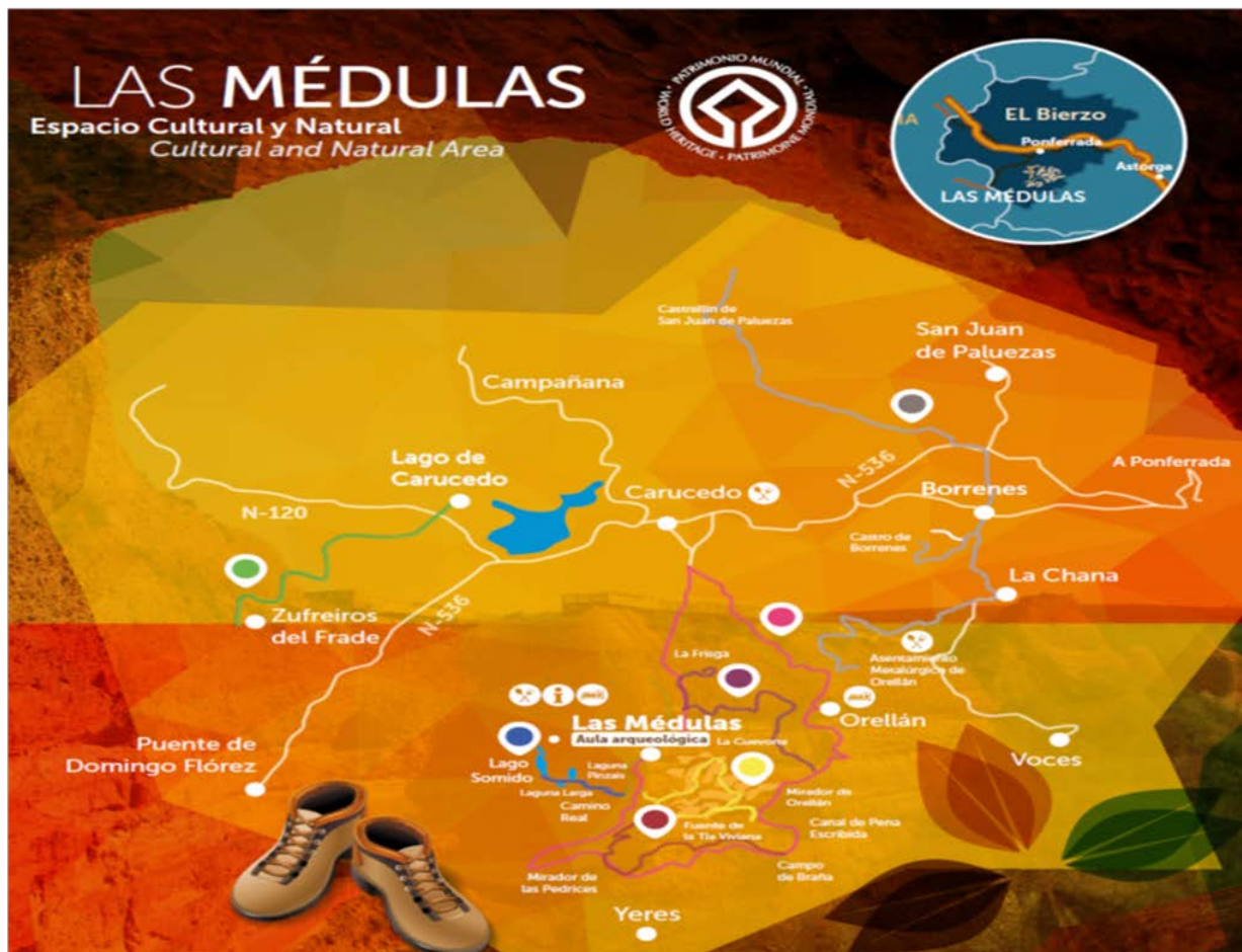
Perspectivas analíticas sobre Las Médulas desde 1997 hasta la actualidad.