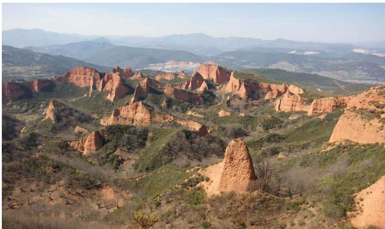
Paraje de Las Médulas. Foto cedida por Fundación Las Médulas.

pios del paraje) de un 24 por ciento, siendo el mayor descenso el de Borrenes, con un 37 por ciento y el menor el de Carucedo, con un 14 por ciento.