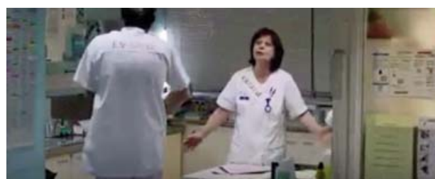
Foto 2. Los enfermeros llevan un cartel pegado: En huelga (En grève).