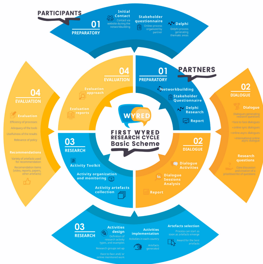
Figura 2. Infografía del ciclo de investigación WYRED (WYRED Consortium, 2017a) Figure 2. WYRED Research Cycle Infographic (WYRED Consortium, 2017a)