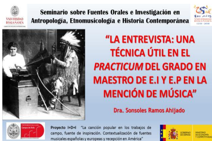
Figura 3: ponencia del seminario

que también pertenece al equipo de investigación del mismo I+D, que la coordinadora del presente proyecto. El día 17 de febrero de 2017 presenté en el seminario “Implementación de nuevas metodologías en el aprendizaje del análisis sociocultural: las fuentes orales y las entrevistas como recurso didáctico” la ponencia titulada “La entrevista: una técnica útil en el practicum del Grado de maestro de E.I y E.P en la mención de música”, donde mostré diversos modelos de entrevistas trabajadas con los alumnos del Grado para que posteriormente, los discentes lo aplicaran durante su estancia en los centros educativos (Figura: 3).