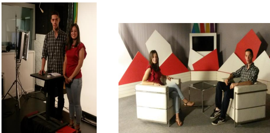
Figura 11 y 12. Grabación de Usal-media

A modo de ilustración, mostramos la imagen de una de las grabaciones de los Usal-media realizadas por los alumnos universitarios en los estudios de TV-USAL (Figuras 10 y 11).