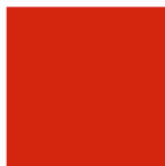
Rojo Sangre de Toro