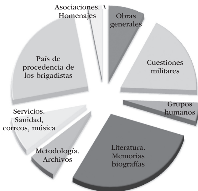
GRÁFICO 1. Obras según la temática

También hemos tenido en cuenta el ritmo de publicaciones anuales, siendo el 2009 el año más destacado, aunque con pequeñas diferencias respecto a los demás.