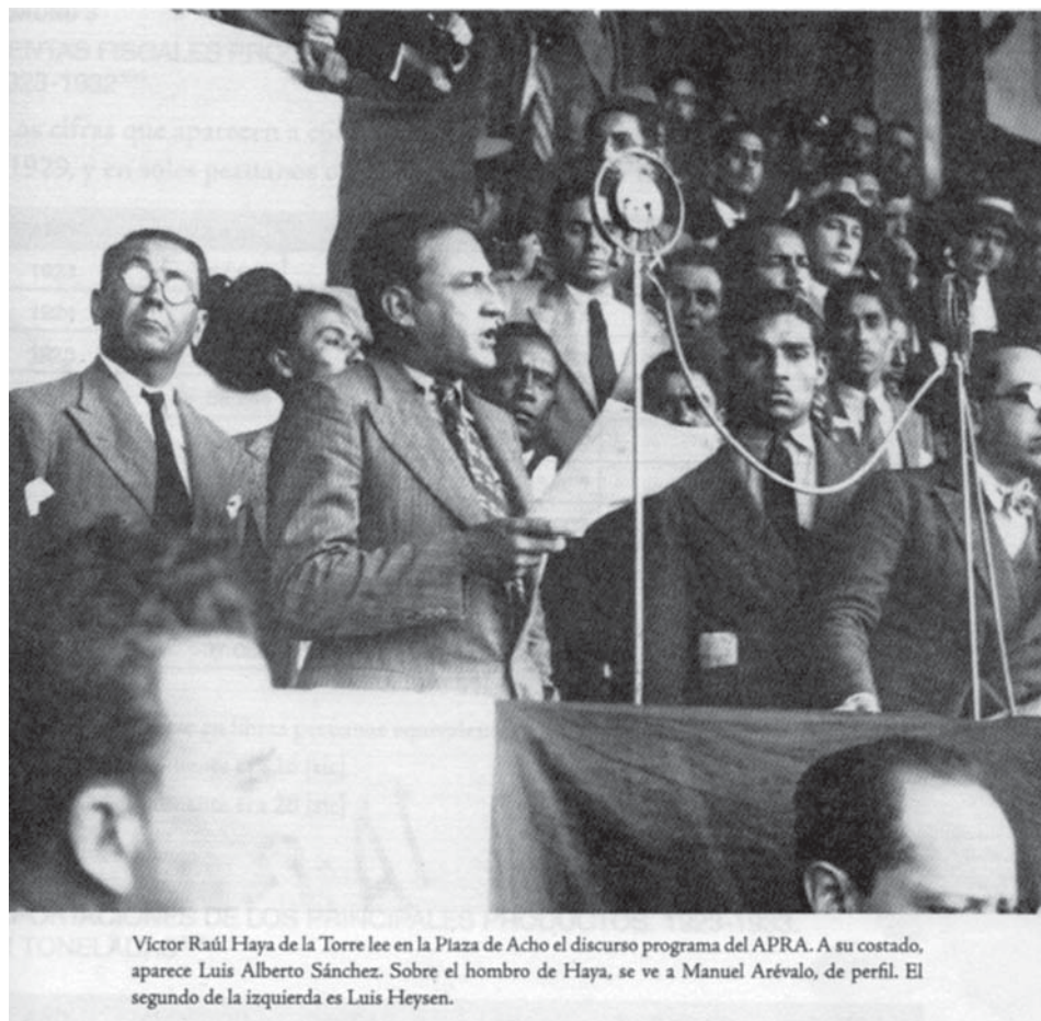
Fotografía de Víctor Haya de la Torre.