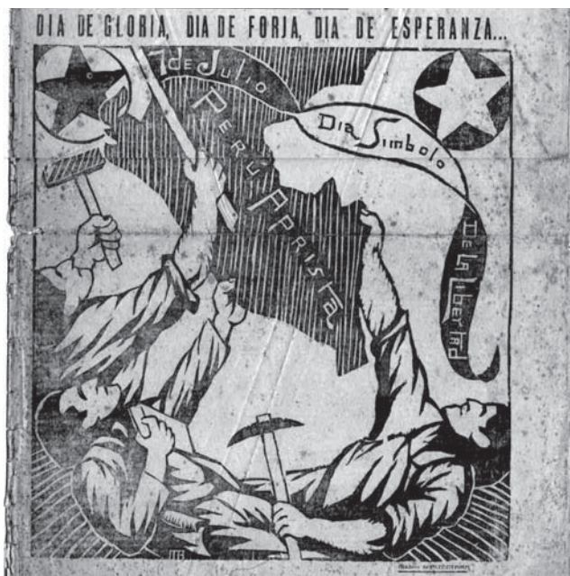
Grabado de Mariano Alcántara: Perú Aprista.

En la parte inferior, 3 hombres que simbolizan al obrero, con una comba en la mano izquierda; al intelectual con un libro pegado hacia el corazón y al campesino con su pico en la mano izquierda. El intelectual y el campesino sostienen el Mapa del Perú, mientras que el obrero sujeta la banderola. Los rostros tienen perfil parecido y expresan una serena pero decidida entrega. Los brazos denotan rudeza, energía y asemejan 3 columnas que sostiene el monumento de la Patria.