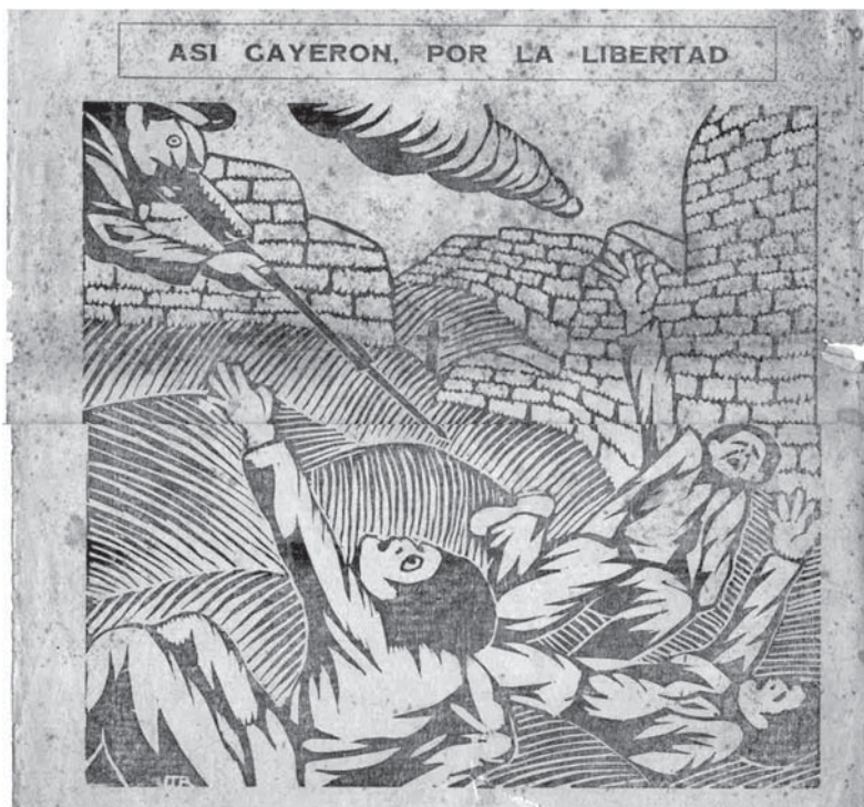
Grabado de Mariano Alcántara: La Masacre.

El Gobierno debe extremar sus medidas para con estos miserables que no han tenido atajos en sus atropellos. Donde dicen no han respetado a las mujeres... Ojalá la sanción sea como reclama esta bochornosa rebelión. Pero, sin esperar juicios, ni demás tonterías que no vienen al caso para bandoleros de esta naturaleza. Acá todo tranquilo, la hoguera se ha mantenido lejos felizmente y está apagándose ya» (Cayaltí, 11 de julio de 1932).