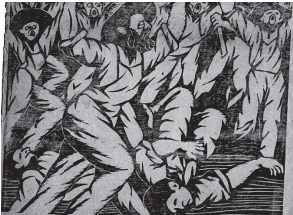
Grabado de Mariano Alcántara: Asalto al cuartel O'Donovan 1932.

El pueblo trujillano, tradicionalmente altivo y beligerante, protagonizó el 7 de julio de 1932 un episodio inédito en nuestra historia republicana. Obreros, campesinos y maestros armados rústicamente asaltaron el cuartel de O'Donovan, redujeron a la tropa y proclamaron la liberación.