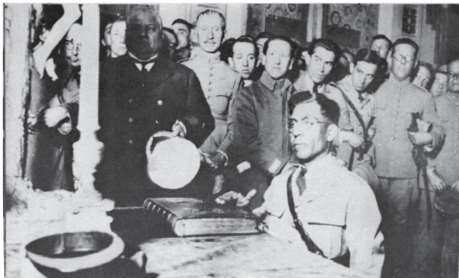
Sánchez Cerro Jura como Presidente de la Junta de Gobierno 1930.

Batallón de Zapadores n.º 3 de guarnición en Arequipa, inició allí una revolución militar (22-VIII-1930) que puso término al régimen mantenido por Leguía durante once años convirtiéndose súbitamente en caudillo popular.