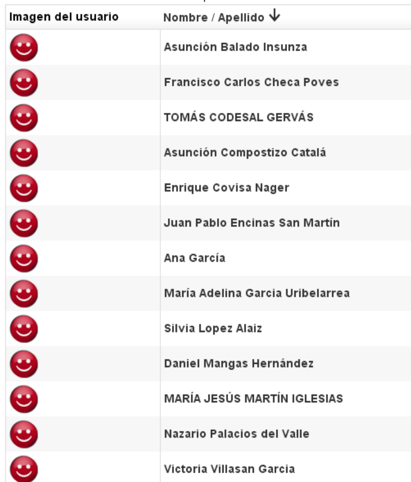
Fig 2. Participantes en la continuación del proyecto ASPIRA

Apellido : Todos A B C D E F G H I J K L M