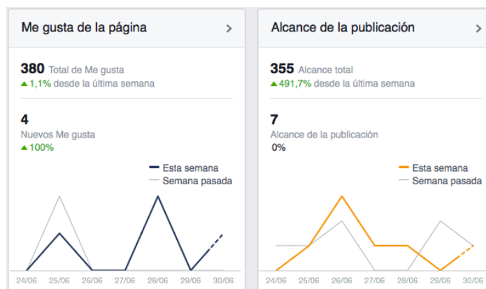
Figura 4 - "Me gusta" y Alcance del perfil de Facebook de la Facultad de Ciencias

Una vez que se ha conseguido alcance y "Me gustan" se han elaborado planes de difusión asociada, en términos de anuncios y publicaciones patrocinadas. A continuación en las siguientes Figuras se presentan los planes específicos de difusión que están actualmente en marcha.