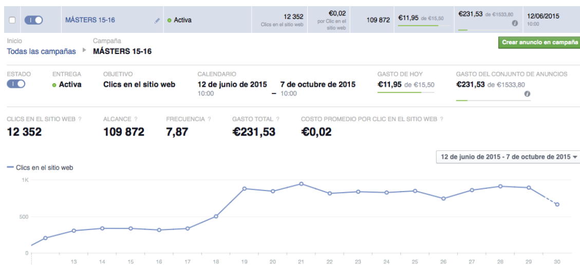
Figura 5 - Resultados - Planes Másters 2015/16

Una vez que se ha conseguido alcance y "Me gustan" se han elaborado planes de difusión asociada, en términos de anuncios y publicaciones patrocinadas. A continuación en las siguientes Figuras se presentan los planes específicos de difusión que están actualmente en marcha.