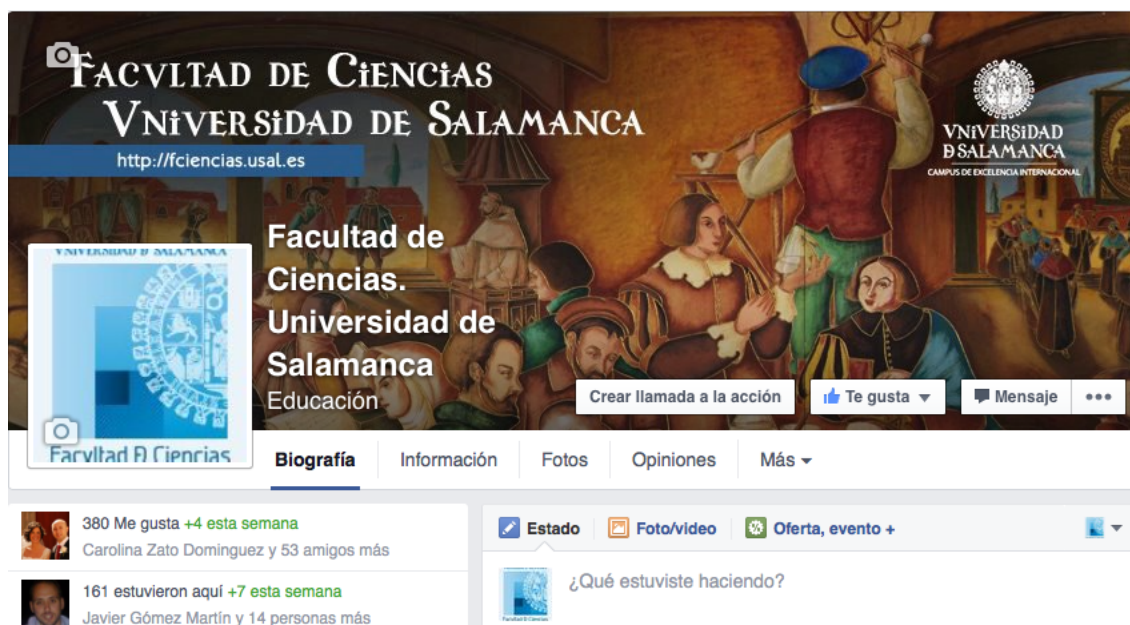
Figura 2 - Perfil de Facebook de la Facultad de Ciencias

Uno de los objetivos del proyecto era potenciar el uso de los medios electrónicos, este objetivo pasa por potenciar la audiencia de los medios sociales. En este sentido, el número de “Me gusta”, en la página de la Facultad de Ciencias tiene una tendencia ascendente desde el inicio del proyecto, tal y como se aprecia en la Figura 3. El próximo objetivo asumible consiste en llegar a los 500 seguidores. El alcance de las publicaciones también se ha incrementado, sobre todo desde que se han puesto en marcha las publicaciones patrocinadas utilizando el presupuesto del proyecto (Figura 4).