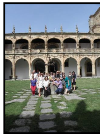
Visita Instituto de Neurociencias y Colegio Arzobispo Fonseca