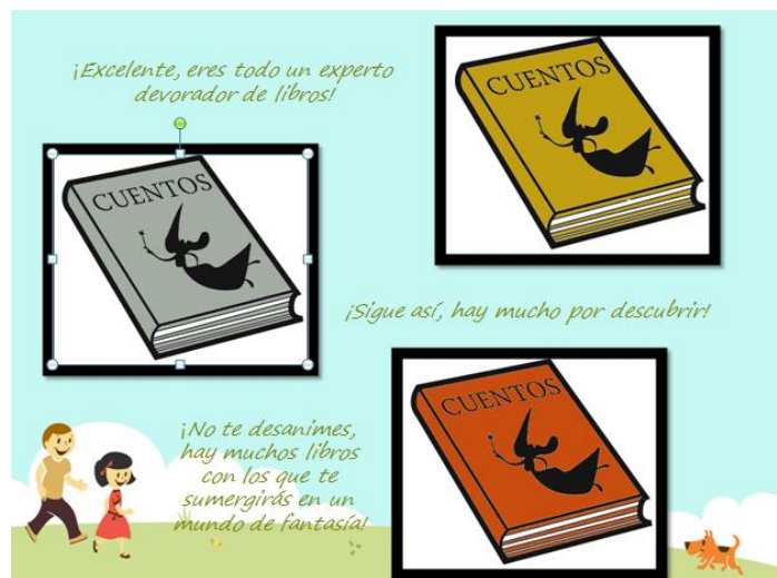
Figura 5. Medallas y recompensas