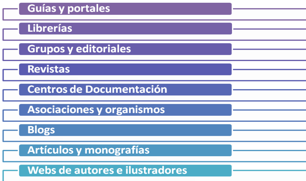
Figura 3. Categorías para la selección de fuentes

Para ello se seleccionaron inicialmente diferentes categorías cuyos resultados se pueden consultar en los anexos I y II.