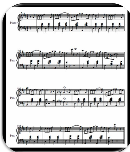
Figura 8. Melodía de la aplicación