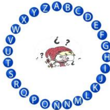
Figura 4. Logo del juego principal