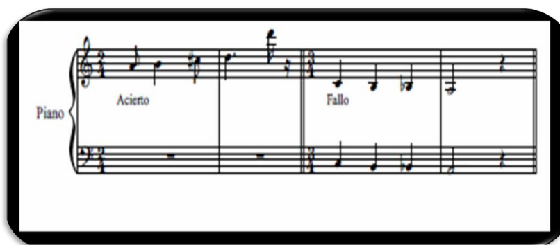
Figura 9. Efectos sonoros para fallos y aciertos