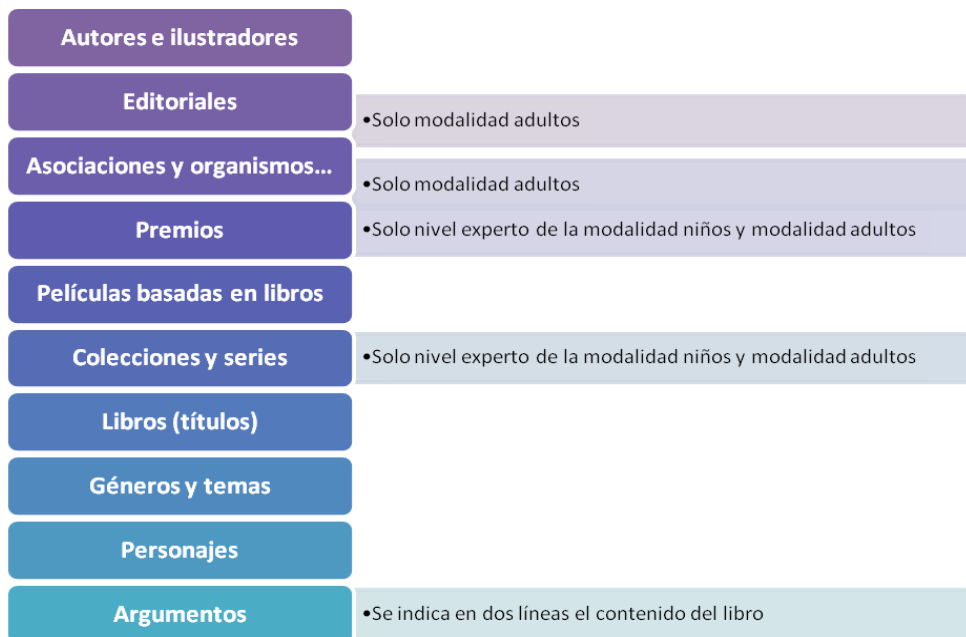
Figura 6. Categorías para la elaboración de preguntas

En base a estos apartados los alumnos redactaron 27 preguntas para cada una de las 3 modalidades y niveles (anexo..) para las cuales debían indicar además de la pregunta, la categoría, la respuesta correcta y la fuente utilizada para realizarla.