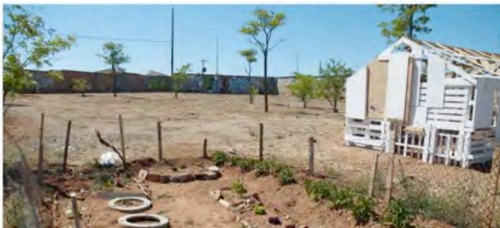
Obra de Marcos Abella

Los proyectos artísticos en colectivo se desarrollan tras una investigación previa individual de cada alumno mediante la lectura personal de libros de referencia (propuestos en la bibliografía especializada de la asignatura), la realización individual y