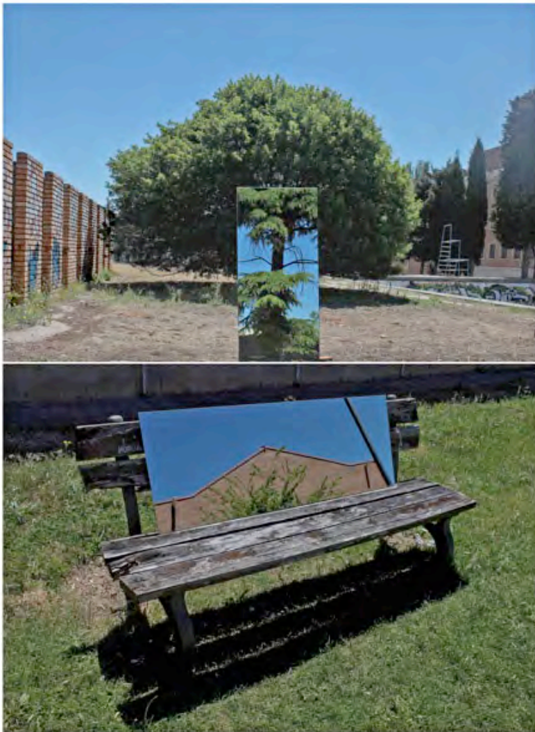
Intervención artística en el campus de Bellas Artes (grupo de estudiantes_2)

4_ Se ha elaborado un inventario completo de las infraestructuras docentes e investigadoras del área de escultura (Inventario de espacios remitido al Vicerrector de Economía y al Decano de la Facultad de Bellas Artes) y un inventario visual de la maquinaria en uso.