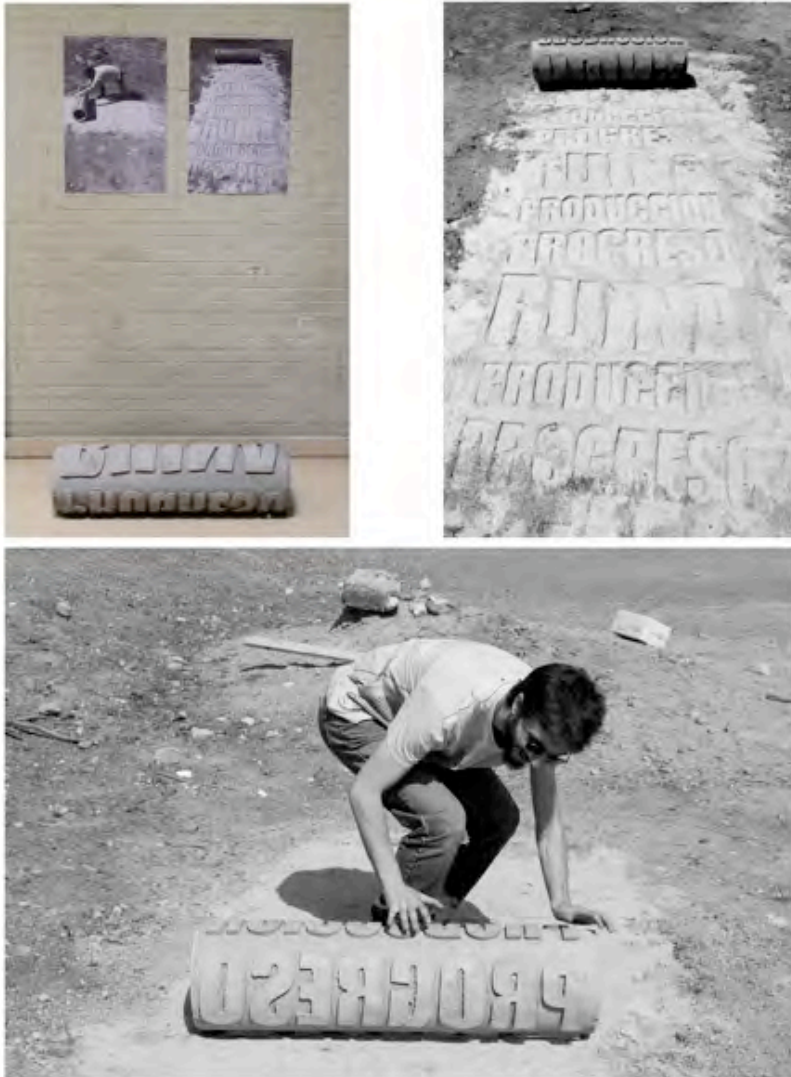
Obra de Marcos Abella