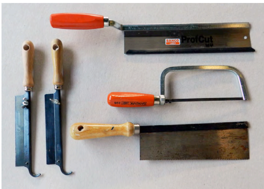
El taller de madera. Herramientas de serrado.

El proyecto de este Curso 2014-2015 ha dado al equipo una forma experimental que a diversificado y ampliado nuestros métodos anteriores. Nuestra idea trata de introducir un uso de herramientas online como metodología de trabajo y una incorporación procesos documentales a fin de dar a conocer diferentes herramientas web capaces de divulgar de una manera sencilla, abierta y continua, los diferentes conocimientos relacionados con las asignaturas. No obstante, hemos de evaluar todavía los resultados y problemas que la implantación del Grado y su coordinación ha suscitado y hemos de desarrollar conclusiones, ya que consideramos esta última propuesta una iniciativa experimental y transicional.