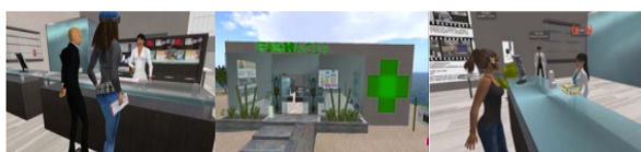
Figura 1. Instantáneas tomadas durante la realización de los seminarios de Atención Farmacéutica y de Dermofarmacia en la Oficina de Farmacia virtual

Según la encuesta de satisfacción, los estudiantes no encontraron dificultades en el manejo de la plataforma. A ninguno de los estudiantes de Grado le resultó difícil el entrenamiento previo, a una amplia mayoría les resultó fácil o muy fácil requiriendo un periodo de entrenamiento menor a 2h. En el caso de los alumnos del posgrado, tres de ellos manifestaron mayor dificultad. Cabe destacar que se trataban de los únicos alumnos mayores de 30 años y con algunas connotaciones especiales de realización de la práctica y dificultades idiomáticas. Los requisitos técnicos y el equipamiento no han supuesto una limitación para llevar a cabo las actividades. Las mayores dificultades encontradas han estado relacionadas con la percepción del sonido, aunque se podrían haber evitado en su mayor parte con el entrenamiento previo del alumno y la correcta utilización de auriculares y micrófono. En las actividades destinadas a entrenar a los alumnos en la comunicación con el paciente (tabla 1), además de aplicar conocimientos estudiados en las clases teóricas, se pretendía enfrentar al alumno a situaciones reales en el ejercicio profesional farmacéutico en una oficina de farmacia. Consiguiendo un aprendizaje mucho más efectivo al situarlo en el contexto en que se desarrolla. Para este propósito son ideales las características de inmersión que presentan los mundos virtuales (figura 1).