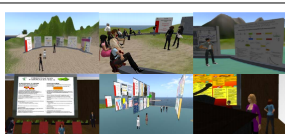
Figura 2. Exposición de trabajos y presentación de comunicaciones del seminario de Farmacocinética Clínica y de la práctica de Legislación y Deontología Farmacéutica

El segundo tipo de actividades (tabla 1), se organizaron como la presentación de resultados científicos en un congreso. Los alumnos debían acudir a la sede del "congreso" en USALPHARMA y registrarse para que los profesores pudieran seguir su actividad en la plataforma. En el plazo previsto debían enviar por correo electrónico sus comunicaciones en formato póster (figura 2). Los trabajos se exponían durante una semana y posteriormente, profesores y alumnos se reunían para que cada grupo defendiera su comunicación y debatir sobre cada trabajo. Para la evaluación de la actividad se consideró el contenido y presentación del poster, la exposición oral y la intervención en los debates.