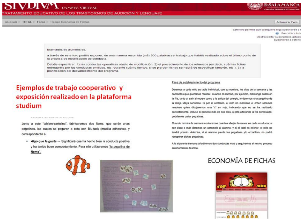
Figura 5. Ejemplo de actividades con metodología trabajo en equipo y/o cooperativo: plataforma virtual