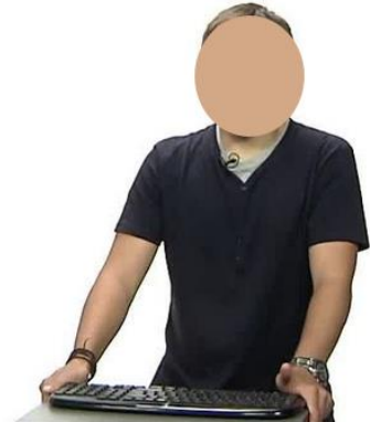
Figura 4. USALMedia.