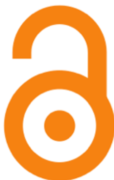
Figura 2. Logotipo que representa las iniciativas relacionadas con el Acceso Abierto

Gold Roads : Son aquellas vías por las cuales el autor paga una cantidad estipulada a la editorial para que esta le permita poner su trabajo científico bajo Acceso Abierto. De esta forma la editorial se asegura de sacar rédito económico a la publicación aunque vaya a encontrarse bajo Acceso Abierto. Esta vía es la menos adecuada según el punto de vista del Acceso Abierto, aunque el resultado pueda llegar a ser el mismo.