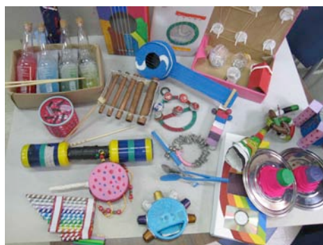
Instrumentos musicales realizados por los alumnos durante este curso 2012-13