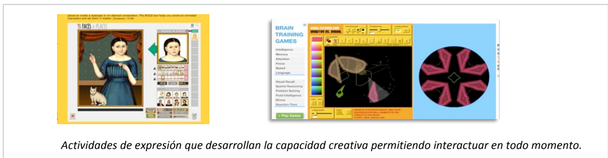
Actividades de expresión que desarrollan la capacidad creativa permitiendo interactuar en todo momento.

. Acceder a programas, aplicaciones, videos, materiales docentes ,enlaces web, etc... que le permite seguir aspectos complementarios y necesarios de las diferentes asignaturas.