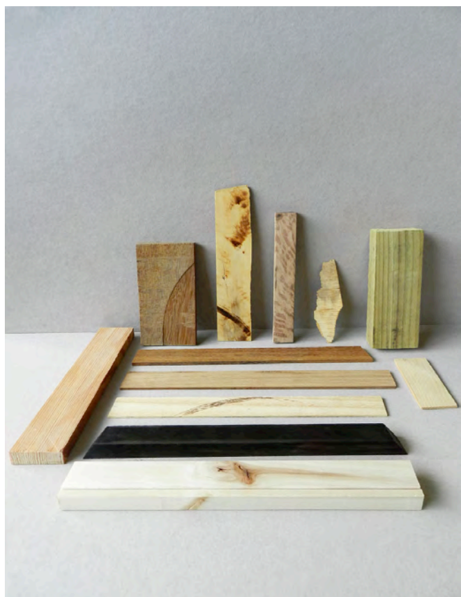
Catálogo de maderas