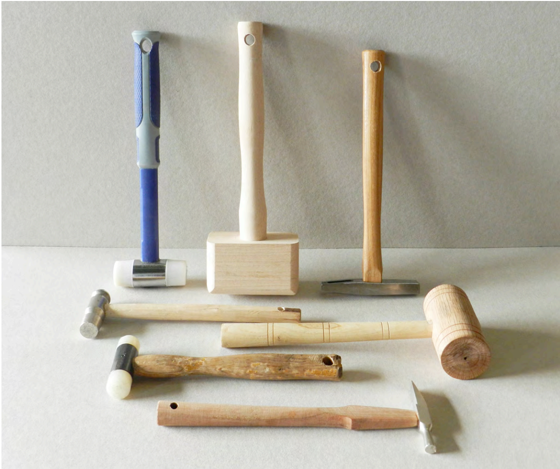
Ejemplo de herramientas básicas del taller de madera.

Para la construcción progresiva de este Proyecto de Innovación y desarrollo, -como pudo ya verse en el número de asignaturas que componían el proyecto ID9/202- nuestra intención inicial ha sido siempre la de tratar de vincular los contenidos sobre la creación artística en escultura con los del vídeo, considerando que hoy en día, ambas disciplinas se relacionan de forma estrecha y complementaria y con la convicción de que su asociación refuerza el espectro creativo del futuro Proyecto fin de carrera de forma evidente, facilitando la transversalidad de las materias y ayudando a reforzar la filosofía experimental que debe presidir estos estudios, por lo que hemos considerado de vital importancia las relaciones entre las distintas áreas de conocimiento.