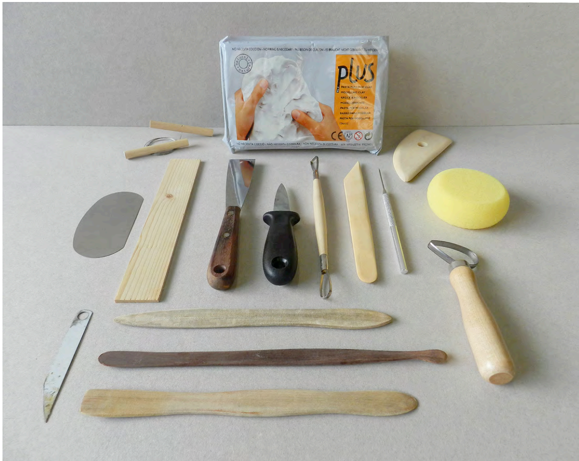
Imágenes de herramienta necesaria para el modelado, vaciado y diseño de prototipos

El actual proyecto de licenciatura, pasará por tanto a convertirse en el proyecto Fin de Carrera con la adaptación al Grado en Bellas Artes en un año. Esta prolija explicación del contexto docente en el que actualmente nos movemos no puede por tanto disociarse los problemas mencionados del desarrollo que pueden tener los Proyectos de Innovación Docente , ya que es indispensable adaptar nuevas metodologías acordes a la reorganización precisa de las docencias actuales de estas asignaturas, no solo en sus contenidos sino además en sus infraestructuras (talleres y laboratorios) mediante un Plan y para ello es también imprescindible una transformación de sus espacios, maquinaria y medios materiales de forma acorde a las homologaciones y exigencias que en materia de infraestructuras establece la Comunidad Europea para