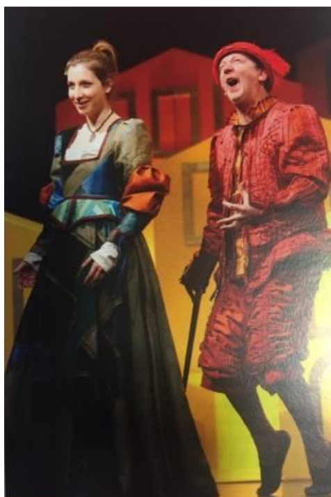
SLIKA 7: Marin Držić: Skup Hrvatsko Narodno Kazalište, Split 28.03.2008.