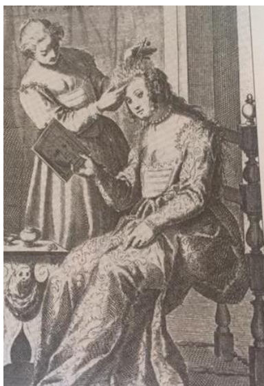
SLIKA 6 Prikaz iz dnevnog života grada