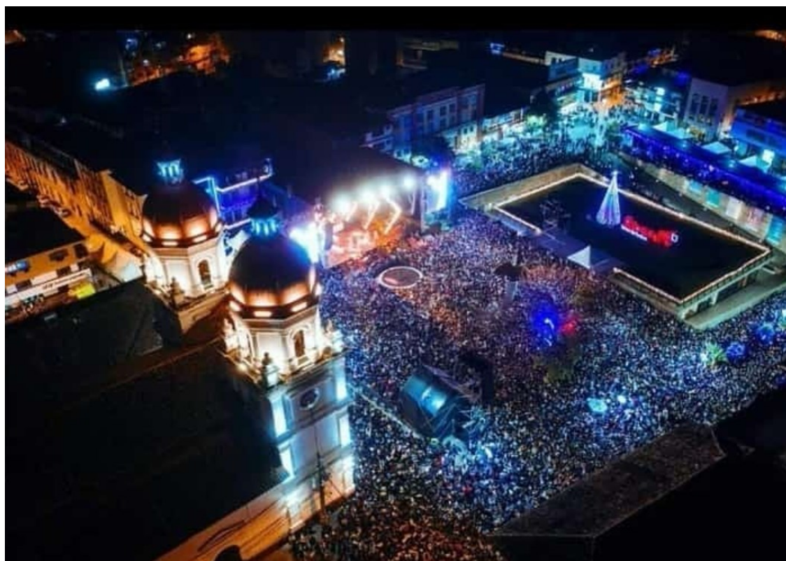
Figura 1. Fiestas de las Tradiciones Rionegreras (diciembre de 2018)