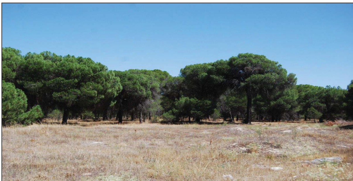
Figura 3: En los arenales la especie más común es el pino mediterráneo. Imagen del pinar de San Pablo, en Peñafiel (Valladolid).

En primer lugar, en cuanto a la flora, el bosque primigenio y endógeno en esta zona estaba conformado por el Quejigo ( Quercus faginea ), y la Encina ( Quercus ilex rotundifolia ) 9 compartiéndolo con los pinares en las zonas de arenales, especialmente el pino piñonero ( Pinus pinea ) y el pino resinero ( Pinus pinaster ) 10 junto a géneros como los Corylus , Ulmus , Juglans , Salix , Betula , 11 es decir, avellanos, olmos, nogales, sauces y el abedul, respectivamente, entre los principales ejemplares. En el bosque de ribera predominaban varias especies del género Populus , es decir, chopos y álamos, pero también alisos ( Alnus glutinosa ). Los juncos, es decir juncáceas y ciperáceas como carrizos ( Phragmites ), eneas ( Typha ), y cañizales ( Arundo donax ), muy abundantes en lavajos y lagunas. Entre otras herbáceas destacaban especies como urticáceas ( Urticaceae ), diferentes tipos de Bromus ( t.sterilis , t.mollis/secalinus ), 12 Ranunculaceae , Poaceae , y por otro lado hierbas forrajeras como Geranium , Ephedra , Plantaginaceae , Gramineae . Otras como las Polygonaceae y Malvaceae , es decir, cizañas, abremanos y ceñilgos entre las principales. Por otro lado abundaban los frutos silvestres tales como frutos del bosque, moras provenientes del género Morus , es decir el árbol de morera, o por otro lado de Rubus , de zarza, también endrinas y gárbulas de enebro o sabelina ( Juniperus ), también en menor medida castaños ( Castanea sativa ) y almendros ( Prunus dulcis ).