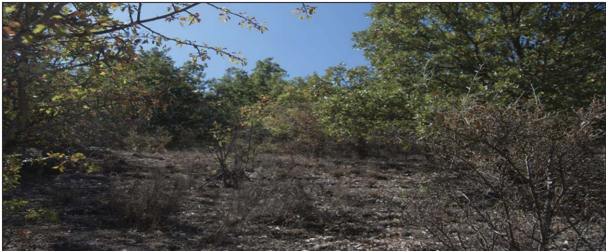
Figura 5: Quejigos en las laderas de los páramos cercanos a Peñafiel (Valladolid).

La fauna predominante en la zona hallada en los yacimientos de El Soto, Las Ruedas de Padilla, y la Mota de Medina del campo, englobaba especies como corzos ( Capreolus capreolus ) venados y ciervos ( Cervus Cervidae /Cervus elaphus ), como cérvidos más comunes, también jabalíes ( Sus Scrofa ), e incluso se han encontrado restos de uros ( Bos primigenius ). 13 Por otro lado, conejos ( Oryctolagus cuniculus ), liebres ( Lepus granatensis ), perdices ( Alectoris rufa ), pero también abundaban alimañas como los tejones ( Meles meles ), y nutrias ( Lutra lutra ) y castores ( Castor fíber ). El gato montés ( Felis sylvestris ), el lince ( Lynx pardinus ) eran especies comunes en la zona y también se han encontrado restos de osos