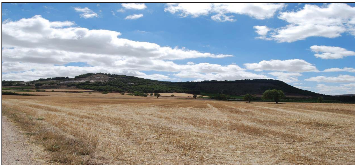
Figura 7: Vista desde la campiña de la ladera o cuesta y el páramo, al fondo podemos observar el Pico de la Mora , cercano a Peñafiel.

dentro de estas sociedades, aparte de sus carices principalmente defensivas. De esta forma, estos centros de poder cumplen un papel hegemónico en su entorno más cercano, aportando un verdadero papel de referente territorial respecto a los asentamientos de menor calado adyacentes a este y cercanos al río de dónde provenían los recursos. Sin embargo, estos centros parece que son independientes entre sí, ya que no existe relación visual entre ellos. 49