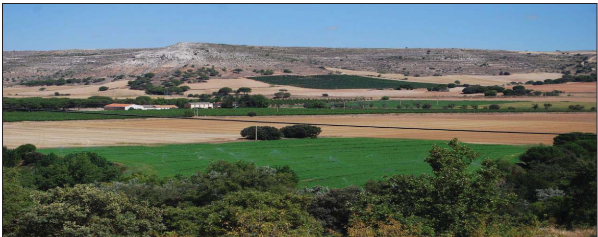
Figura: 10: Vista de la vega del Duero, un espacio muy apto para la actividad agraria.

Los Vacceos se dedicaban especialmente a la producción triguera con el hallazgo de varias especies de Triticum , en los análisis carpológicos realizados, pero también cebada, avena y mijo. 76 No existía la explotación de metales en su zona, destacando la propiedad colectiva para muchos autores como modo de producción, ya que estos son de carácter corporativo, encontrándose diferentes estructuras de almacenamiento que por sus amplias dimensiones y las herramientas allí encontradas sería un almacén común. 77 En primer lugar, dejando a un lado la repercusión historiográfica del texto de Diodoro, ya desfasado, la propiedad colectiva no se puede equiparar a una cierta igualdad económica, por lo que los trabajos y labores pueden ser colectivos, pero la posesión de la tierra y de la cosecha puede estar en pocas manos, como se aprecia en algunos ajuares de enterramientos con elevada presencia de objetos de valor o prestigio en los que la caballería aristócrata poseía los recursos principales, lo que evidencia una clara desigualdad. 78