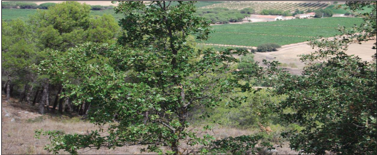
Figura 4: Encinas, las cuales componían la especie vegetal más abundante en la zona.