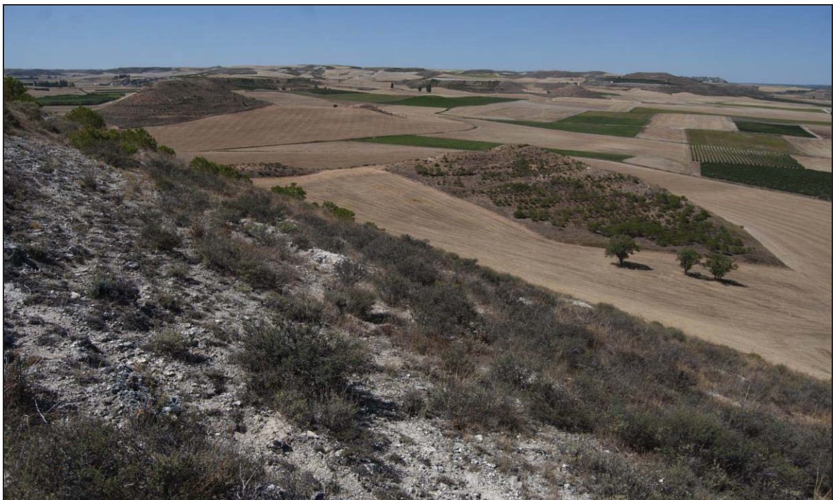
Figura 11: Otra imagen desde el Alto de Pajares , dónde se puede observar una buena vista del fondo del valle y las campiñas, zonas muy aptas para la agricultura y el pastoreo.

como, garios, azadas, horcas, al igual que rejas de arado y vilortas en las casas, lo que indica la existencia de propiedad privada. 79 Además, según Caro Baroja. J sería más apropiado hablar de colectivismo que de comunismo , 80 otros como Vigil. M o Domínguez Monedero piensan que este colectivismo vacceo, extensible también a las actividades ganaderas comportaría una propiedad colectiva de la superficie agrícola; lo que a su vez garantizaría el orden socio-económico y el sistema social aportando así una gran cohesión al mismo. 81 Aunque, en todo caso, el panorama descrito por Diodoro se llevaría a cabo en respuesta a una economía de guerra y llevada por la necesidad de abastecimiento del ejército y las ciudades vacceas. 82