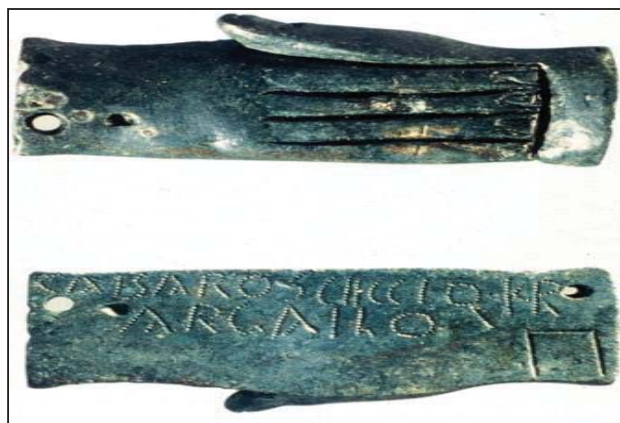
Figura 9: Tésera de hospitalidad del siglo I d.C. hallada en Intercatia , Paredes de Nava (Palencia). Camacho. R, (7 y 28 agosto 2010), “Homenaje al Dr. Manuel Silva Vázquez”. Disponible en: http://paredesdenava2010.blogspot.com/p/mesa-redonda.html

la Devotio con un cierto contenido espiritual y de dependencia de un grupo sobre otro llegando a dar la vida por el jefe o caudillo, además esta última como causa primordial desintegradora de las gentilitates 68 .