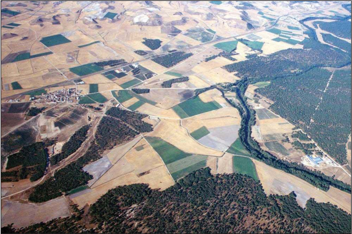
Figura 1: Fotografía aérea de la zona arqueológica de Pintia , en Padilla de Duero, dónde podemos observar el paisaje propio de la cuenca media del Duero. Centro de Estudios Vacceos Federico Wattenberg (Universidad de Valladolid) 2018 ©. “Los Vacceos”, en Pintiavacceas [en línea]. Disponible en: https://www.pintiavacceas.es/