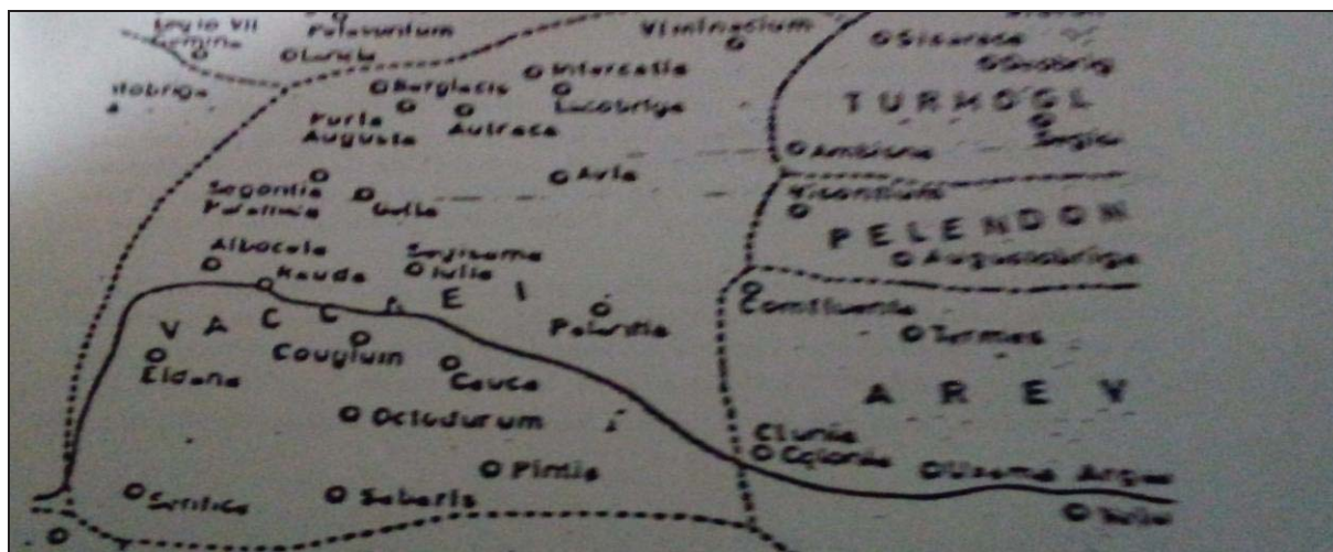
Figura 16: Mapa del territorio vacceo según Tovar, A., dónde se localizan las ciudades y núcleos urbanos de las que se atestigua su emplazamiento. 97

En cuanto al número de urbes vacceas y remontándonos a los testimonios de los clásicos, en primer lugar Plinio nombra diecisiete ciudades incluyéndolas dentro del área de influencia vaccea. Además casi un siglo después Ptolomeo ha reforzado el testimonio de Plinio, pero asignándole veinte ciudades. Eldana , Cauca , Pintia , Arbocola , Intercatia , Gella , Sentice , Octodurum , Pallantia , Rauda o Lacobriga , son algunas de las ciudades vacceas citadas tanto por Plinio, como por Ptolomeo, aunque muchas de estas no se ha logrado ubicarlas ni identificarlas como sucede con Nivaría o Vico .