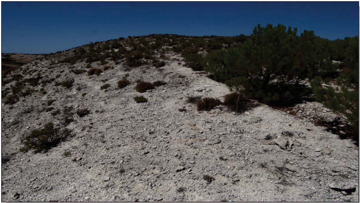
Figura 13: Alto de Pajares en los alrededores de Pintia , en Padilla de Duero, dónde los vacceos extraían piedra y cales.