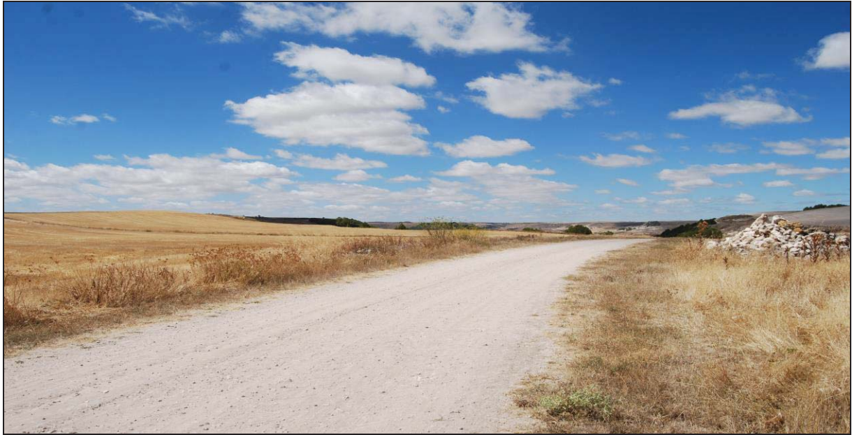
Figura 8: Vista de un páramo en el que podemos observar un “mojón”, o “majano”, una acumulación de piedras que como hito siempre ha demarcado espacios como ahora entre propietarios agricultores.

Los límites y fronteras naturales de la región son bastante imprecisas, remontando el curso del Duero, la frontera vaccea llegaría hasta cerca de Rauda , actual Roa 59 . Otro punto poco esclarecido sería el referente a la frontera sur, dónde Cauca, conformaría un bastión natural ante las estribaciones cretáceas antes de las serranías de Segovia, que se sitúa resguardada por el río Eresma, emplazándose en la vertiente oriental del río, desde Salosancho, hasta Zamora. En su parte occidental, el Esla configura el límite natural más consolidado haciendo frontera con los Astures, y desde la zona de Benavente ascendería hasta el norte y el borde de la cornisa cantábrica haciendo frontera en los enclaves de Sasamón 60 , Sahagún, o Herrera, que cerraba la frontera pasando por Burgos, el Valle del Esgueva, hasta Roa, más o menos, ya que Uxama o Clunia , eran ciudades Arévacas.