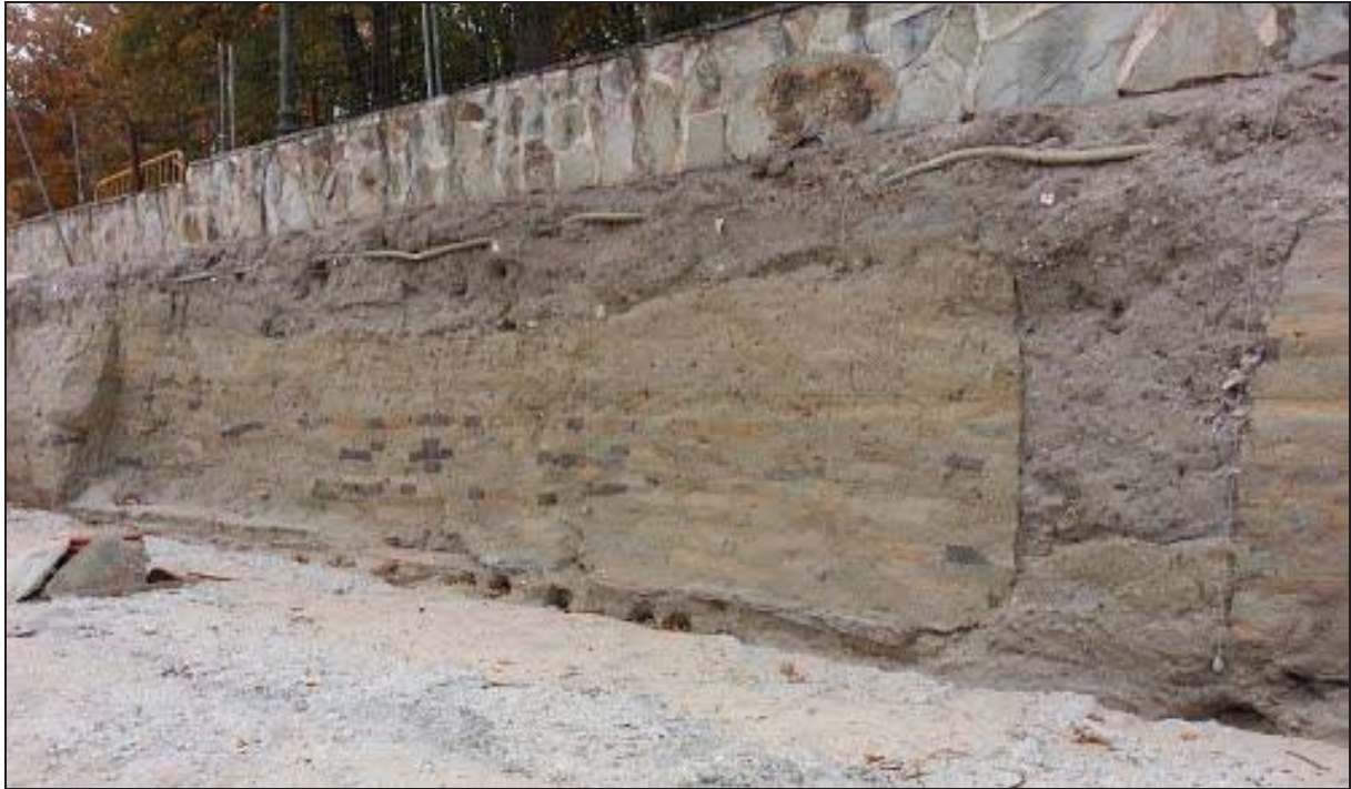
Figura 15: Antiguo lienzo de la muralla de Cauca, Coca (Segovia).

La planimetría del entramado urbano se adaptaba a la morfología de sus emplazamientos y defensas naturales, como altozanos, taludes del propio río, cerrando la fortificación por medio de defensas al estilo muro gallicus , cercando las áreas más proclives a recibir un ataque, dibujando un espacio irregular y polinuclear en torno a barrios y calles, pero con un sentido del orden claro especializado en distintas áreas funcionales, muchas veces, separados, como el de Carralaceña , en Pintia , dónde se ubicaría un barrio artesanal. 89 Además, se abrirían calles principales por las que discurriría la población y el ganado, vertebrando así los espacios dedicados a los principales edificios de la población. Por otro lado, contaríamos con un espacio destinado a los muertos, el campo de urnas sobre el que se levantan estelas, las necrópolis, y existía un posible santuario adyacente a la necrópolis. 90