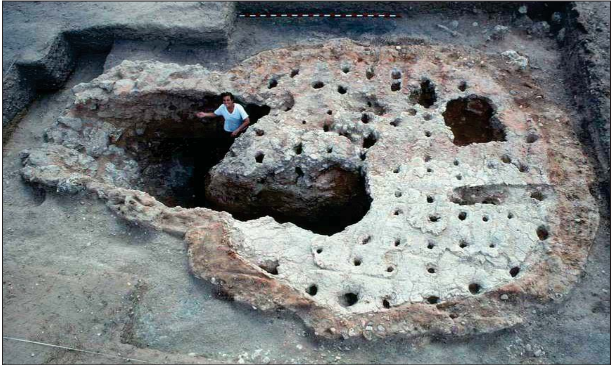
Figura 12: Horno alfarero del área industrial de Carralaceña , perteneciente al yacimiento de Pintia , dónde se confeccionaban cerámicas a torno vacceas de gran calidad. Centro de Estudios Vacceos Federico Wattenberg (Universidad de Valladolid) 2018 ©. “Los Vacceos”, en Pintiavaccea [en línea]. Disponible en: https://www.pintiavaccea.es/