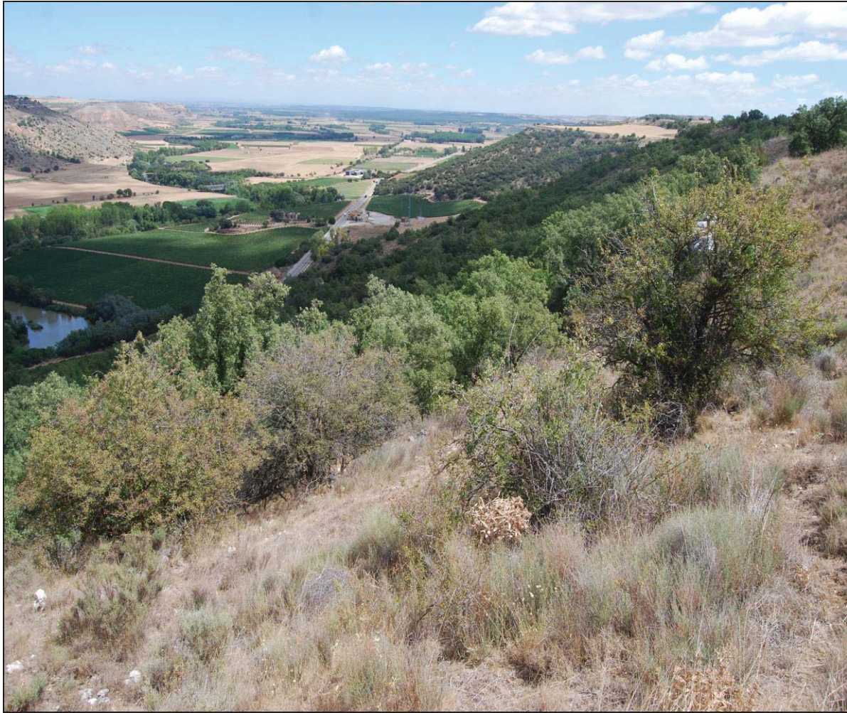
Figura 2: Imagen del valle que salpica el Duero hacia Rauda , la actual Roa de Duero, dónde podemos ver en esta vertiente de ladera algunos quejigos, al fondo, el Duero, su vega y campiña.

Desde el punto de vista geológico y geomorfológico la cuenca del Duero supone una estructura sustentada en el llano de la meseta y la depresión que conforma el Duero a su paso se configura como una escudilla conformada por sedimentos terciarios y cuaternarios. Así, nos topamos con una disposición geomorfológica general dominante con relieve en general suave, de llanura aluvial de amplio fondo de valle y terrazas, con placas arenosas de aluviones cuaternarios sobre el material del Mioceno, 4 fundamentalmente margas y arcillas, pero en altas cotas predominan las calizas permeables. Llegados a este punto, destacan los dos componentes geomorfológicos típicos de la cuenca central del Duero, los páramos, y las cuestas, 5 y algunos cerros testigos, y otras formas residuales típicas del desmantelamiento de las plataformas de los páramos erosionados. Se diferencian principalmente tres estructuras