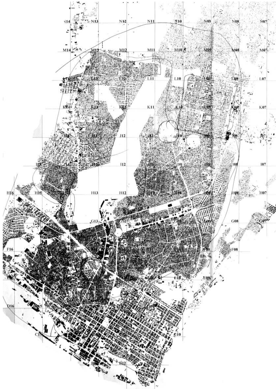
Fig. 3. Maputo: tejido urbano y patrones de textura entre lo formal y lo informal. “Hibridación” y “contaminación” son palabras clave para entender nuevas visiones sobre esta ciudad y sus valores expresivos. Dibujo del autor, elaborado con la cartografía de Maputo de 2005.