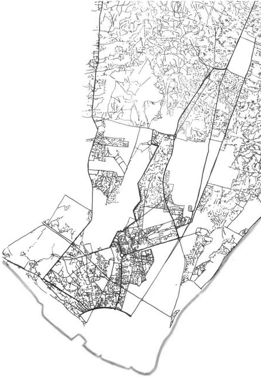
Fig. 2. Maputo: espacio urbano y subestructura física capilar informal. Ciudad con diferentes contextos y relaciones urbanas, cuyos fragmentos componen un mosaico polimórfico constituido por diferentes formas de vida citadina y que, combinados entre sí, se traducen en una multiplicidad de realidades que se yuxtaponen. Dibujo del autor, elaborado con la cartografía de Maputo de 2005.