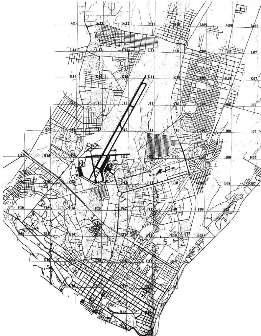
Fig. 1. Maputo: espacio urbano y estructura física formal. Los ciudadanos se localizan en espacios urbanos emergentes, en los cuales procuran soluciones que la ciudad de la retícula colonial todavía no ofrece en condiciones de acceso monetario y de funcionalidad o de disponibilidad de suelo. Dibujo del autor, elaborado con la cartografía de Maputo de 2005.

caracterizan por su capacidad de reintroducción de símbolos y significados auto renovados.