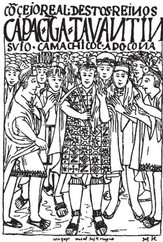
Figura 4. Ilustración procedente de la crónica de Guamán Poma de Ayala que muestra al consejo real. Nótese que la figura central porta un vestido decorado con tocapus.