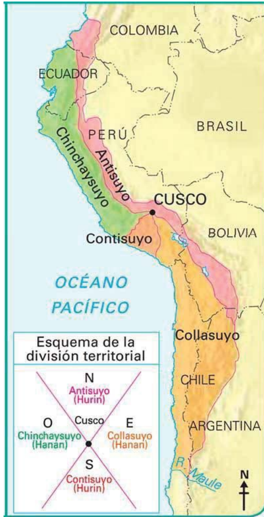
Figura 2. Mapa político actual con la división cuatripartita del imperio inca superpuesta.