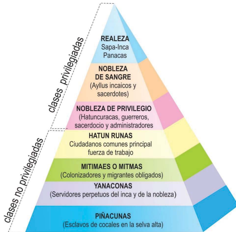
Figura 3. Pirámide social inca