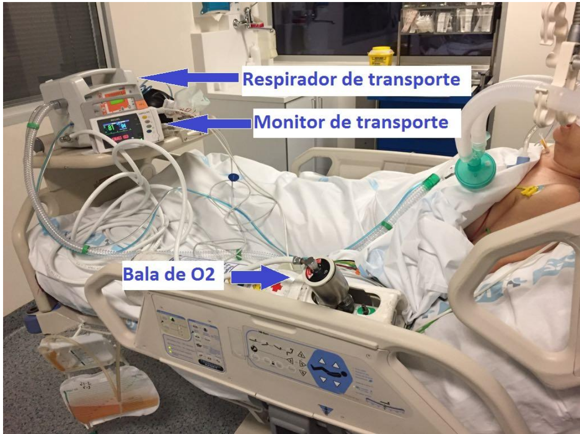
Respirador de transporte, monitor de transporte, bala de O2: