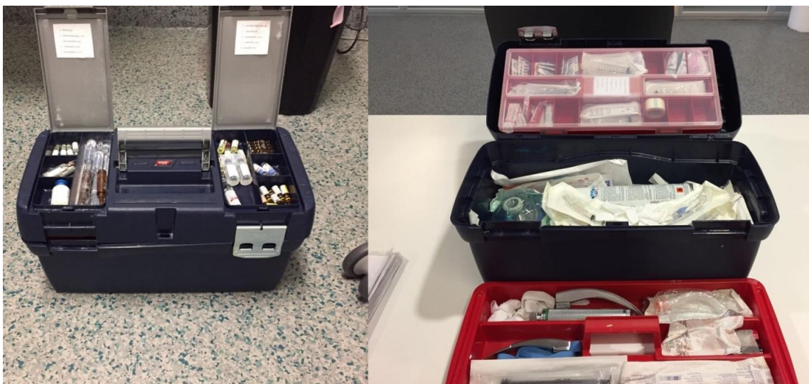
Maletín de transporte: