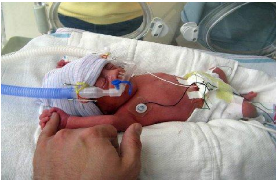
Figura 3: CPAP interfaz nasal en prematuro.