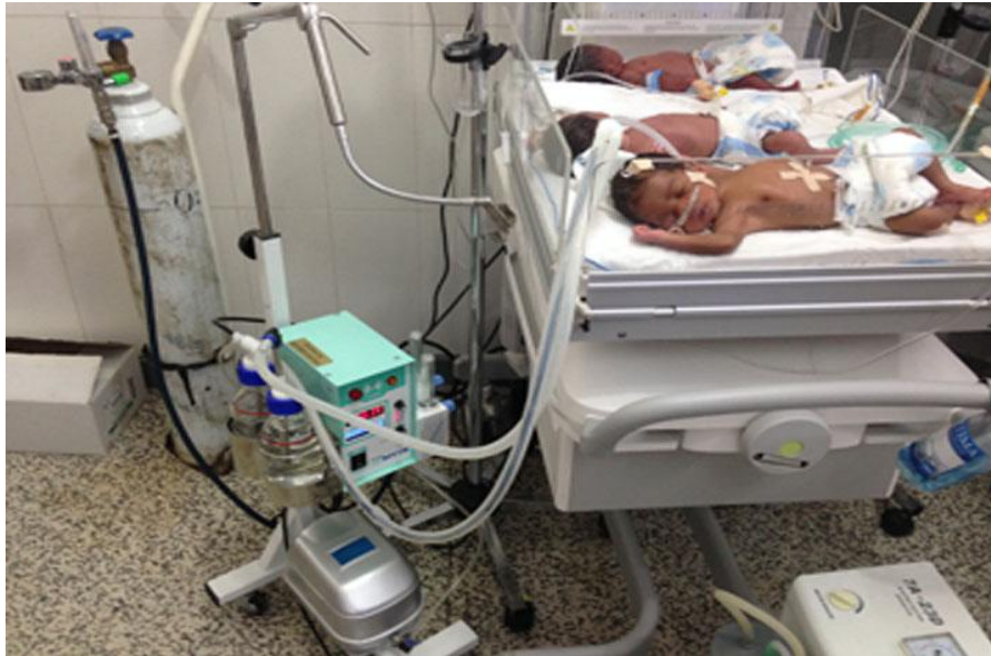
Figura 6: CPAP Burbuja