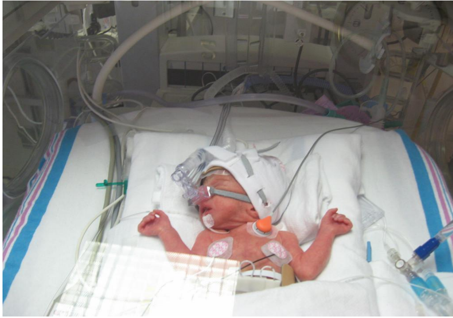
Figura 2: CPAP con interfaz tipo máscara nasal y tubo en T.