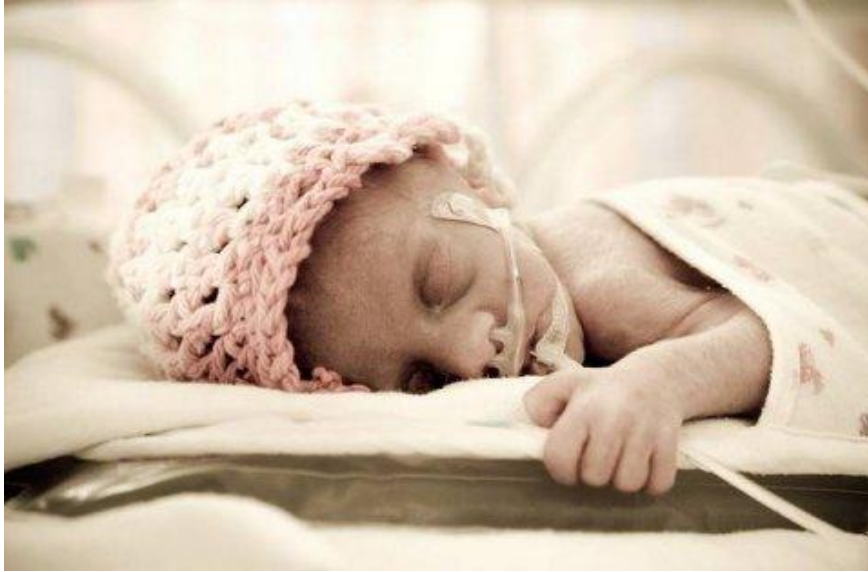
Figura 4: CPAP con gafas nasales.