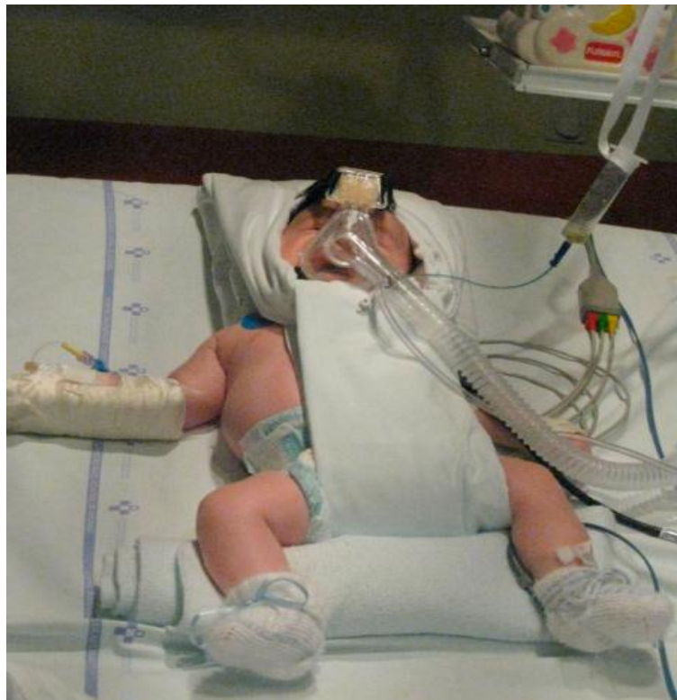
Figura 1: CPAP con interfaz tipo máscara nasal.