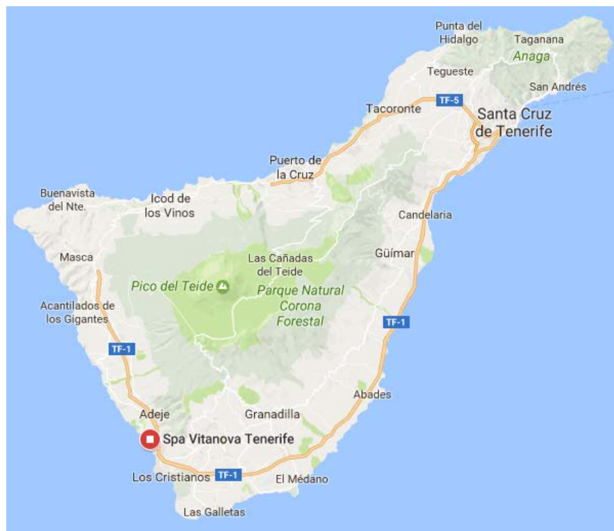
FIGURA 3.1. Mapa de localización de Dreamplace.