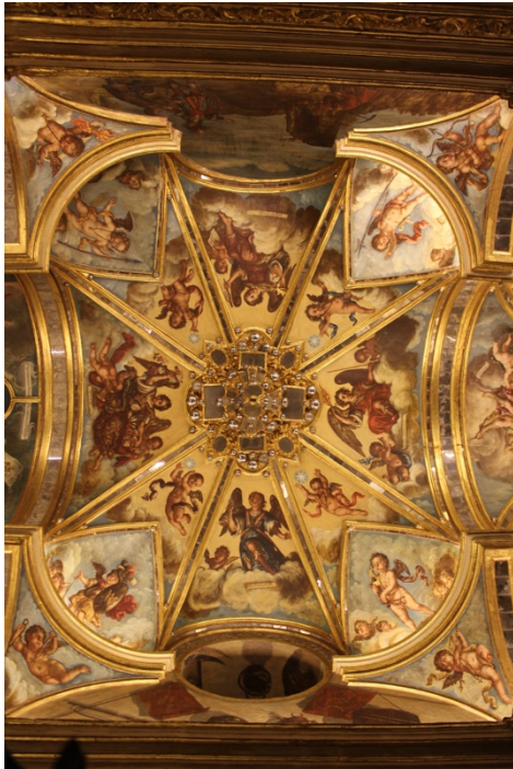
Fig.9. Detalle de la bóveda del antecamarin de Lepanto, Domingo Chavarito, entre 1730 y 1751. Camarín de Nuestra Señora del Rosario, Iglesia de Santo Domingo, Granada.