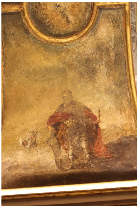
Fig.11. Rey David , autor desconocido, entre 1744 y 1773. Camarín de Nuestra Señora del Rosario, Iglesia de Santo Domingo, Granada.

los atributos de mujer apocalíptica: el resplandor de sol y la luna como pedestal 57 . La Inmaculada está escoltada por sendos querubines que en sus manos portan flores alusivas a virtudes de la Virgen. El de la izquierda lleva un lirio o flor de lis, símbolo de la realeza de María y el de la izquierda lleva en una rosa, emblema de la belleza, y un ramillete de azucenas, aludiendo a la pureza. El lienzo está rodeado por un impresionante marco de cornucopias de estuco recubiertas de pan de oro y que en su interior contienen piedras de ágata muy pulidas que reflejan la luz, de tal modo que se quiere crear un resplandor alrededor de la Inmaculada.