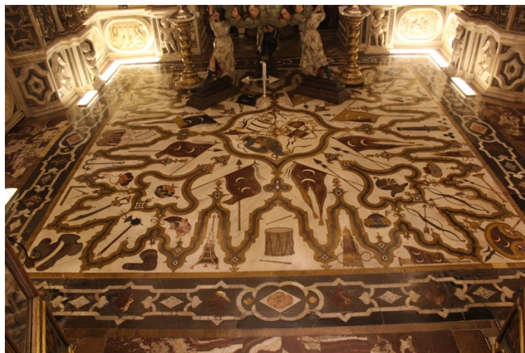
Fig.14. Suelo de la estancia central , Salvador de León y Juan de Aranda Salazar, entre 1727 y 1773. Camarín de Nuestra Señora del Rosario, Iglesia de Santo Domingo, Granada.