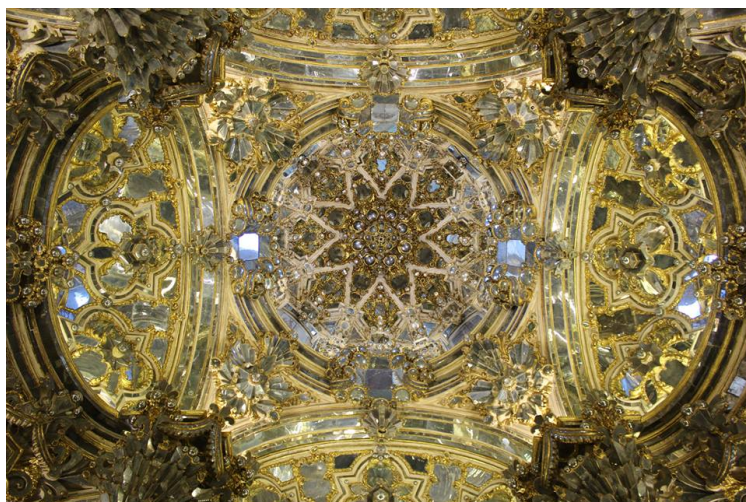
Fig.15. Bóveda de espejos de la sala central del camarín , autor desconocido, entre 1727 y 1773. Camarín de Nuestra Señora del Rosario, Iglesia de Santo Domingo, Granada.