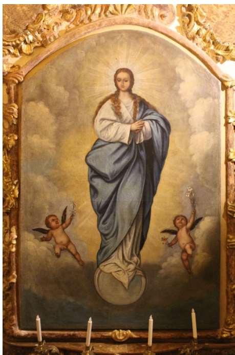
Fig.10. Inmaculada , autor desconocido, 1799. Camarín de Nuestra Señora del Rosario, Iglesia de Santo Domingo, Granada.

conflicto granadino como un simulacro a pequeña escala de lo que luego supondría la batalla de Lepanto 55 . También hay en las paredes laterales dos relieves bélicos de Luis Narváez firmados en 1771, realizados en alabastro con marcos dorados de rocalla. Sin duda se trata de uno de los aspectos más curiosos de esta sala, ya que con ellos se quiso dejar constancia de batallas contemporáneas a la construcción de este edificio. Por la fecha de ejecución, la indumentaria de los personajes, el tipo de acción en el campo de batalla, las armas empleadas etc. podemos deducir que se tratan de escenas de la Guerra de los Siete Años (1756-1763) desarrollada en las colonias americanas allende los mares.