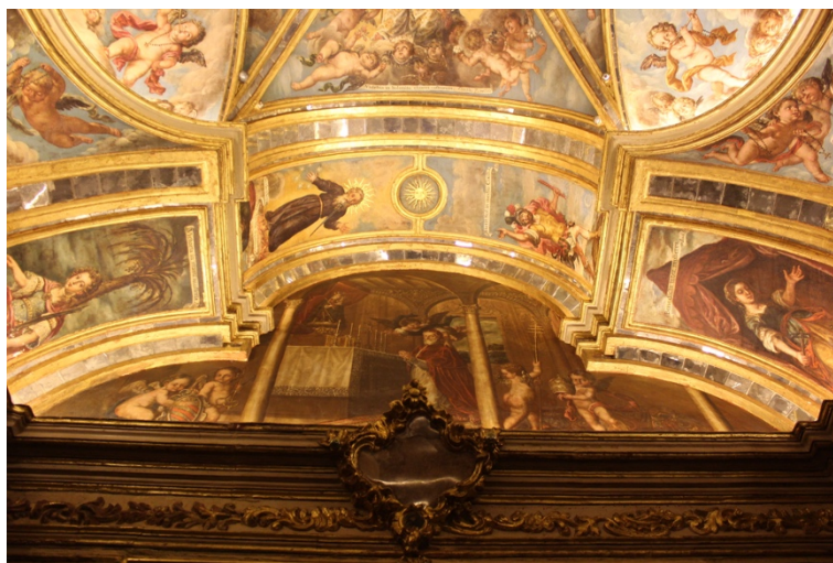
Fig.8. San Pio V y prefiguraciones cristológicas y marianas , Domingo Chavarito, entre 1733 y 1751. Camarín de Nuestra Señora del Rosario, Iglesia de Santo Domingo, Granada.

se traslada al frente enemigo para dar la victoria al pueblo escogido 48 . Todas estas representaciones de personajes bíblicos están inspiradas por colecciones de grabados 49 , estampas y biblias ilustradas 50 que eran un recurso imprescindible en todos los talleres de la época.