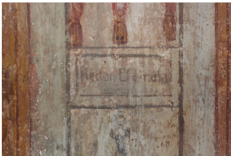
Fig.6. Detalle de la pintura mural del antecamarín de Lepanto, autor anónimo, 1770. Camarín de Nuestra Señora del Rosario, Iglesia de Santo Domingo, Granada.

Sobre los dos almirantes, mencionados anteriormente, están Juan de Austria con una bandera en la que está su lema: “ in hoc signo vinces ”, referente a la cruz y al otro lado Marco Antonio Colona con la bandera pontificia. Encima de todos estos retratos está la inscripción: “ Pervenerunt principes coniuncti psalteribus ”, es decir “Llegaron los príncipes unidos por el salterio” 44 , haciendo clara alusión a la mediación de la Virgen y el poder de la oración del Rosario como factores que consiguieron la victoria sobre los otomanos en Lepanto. En el centro hay un óvalo en el que está pintada la luna con la leyenda: “ Luna perfecta in aeternum ”, que significa “como la luna, que permanece para siempre”. Se trata de un versículo del salmo número 89 , que nuevamente hace alusión a la Virgen María como la luna.