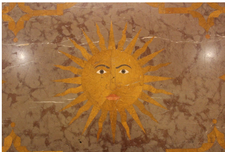
Fig.3. Sol: detalle del suelo del transparente o postcamarín, autor desconocido, entre 1727 y 1773. Camarín de Nuestra Señora del Rosario, Iglesia de Santo Domingo, Granada.

una metáfora creada por los Padres de la Iglesia. Con esta metáfora defendían que tanto María como la Iglesia, son como la luna, un astro que no brilla con luz propia si no que resplandece con luz reflejada, es decir refleja la luz del sol, al igual que María y la Iglesia que reflejan la luz de Cristo 35 . Con estas analogías se compara a Dios con el sol y a la Virgen, en su papel de mediadora entre Dios y los hombres, con la luna. Esta similitud se va a representar iconográficamente a través del sol y la luna de forma bastante reiterativa en el camarín. Por ejemplo, también la podemos encontrar en uno de los significados que se le da a la luz en este camarín. La luz del sol, que como antes hemos dicho se relaciona con Dios, entra por el gran ventanal de la sala capitular y se refleja y hace brillar la imagen argéntea de la Virgen del Rosario. En este sentido, recordemos que el oro siempre se ha relacionado con el sol y con Dios, y la plata con la luna y la Virgen María. De tal manera que la conjunción de la luz del sol y el reflejo de esta en el traje de plata de la sagrada imagen hacen alusión también al Mysterium Lunae .