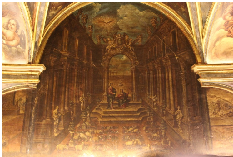
Fig.12. Divina Pastora , Domingo Chavarito, entre 1744 y 1773. Camarín de Nuestra Señora del Rosario, Iglesia de Santo Domingo, Granada.

Cristo, el Buen Pastor, nos presenta a María como Pastora de las Almas, que con su ejemplo conducirá a ese rebaño por el camino de la virtud y la gracia, hasta alcanzar la salvación.