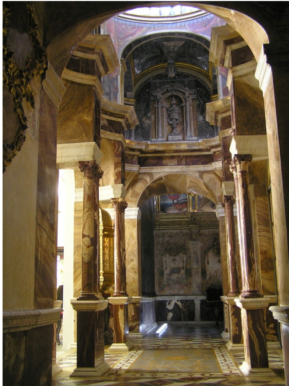
Fig.2. Transparente o postcamarín del Camarín de Nuestra Señora del Rosario , autor desconoció, entre 1727 y 1773. Camarín de Nuestra Señora del Rosario, Iglesia de Santo Domingo, Granada.

y Moreno 31 , rematados por unos ángeles de alabastro que recogen unos cortinajes esculpidos en el mismo material. Estos relieves contienen en la parte superior unos relicarios que, en origen, eran de plata y piedras preciosas, pero que por desgracia fueron expoliados por las tropas francesas en el siglo XIX. Además, también está decorado el transparente con pinturas murales que enseguida pasaremos a analizar en clave iconográfica. Esta estancia es, quizás, la que más desapercibida ha pasado desde el punto de vista iconográfico e iconológico en todos los estudios realizados sobre el camarín. En todas las publicaciones existentes se analizan los valores arquitectónicos, compositivos y espaciales de este lugar, pero sin embargo ninguna analiza su contenido iconográfico.