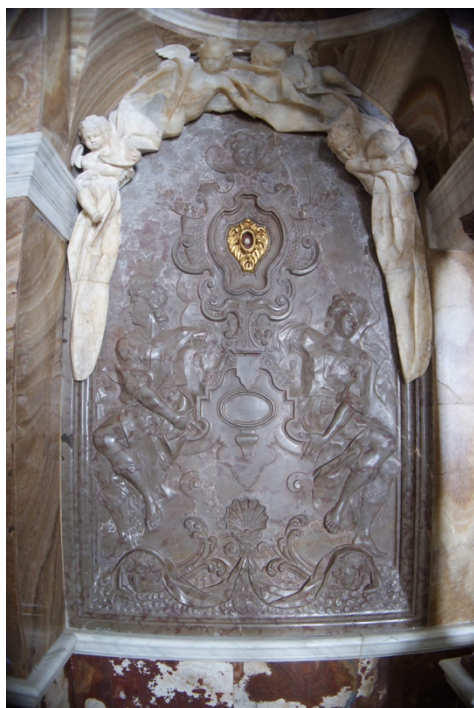
Fig.4. Relieves con relicarios , Agustín de Vera y Moreno, Siglo XVIII. Camarín de Nuestra Señora del Rosario, Iglesia de Santo Domingo, Granada.