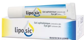
Unguentos Liposic® (carbómero) vidal.fr

Separaron a los 96 pacientes que incluyeron en su estudio en 3 grupos: