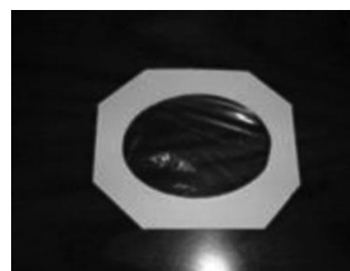
Cubiertas de polietileno (14)

Las dos últimas se cambiaban cada 12 horas o según fuera necesario, si se contaminaban o estropeaban.