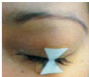
Cinta adhesiva biblat.unam.mx (2)