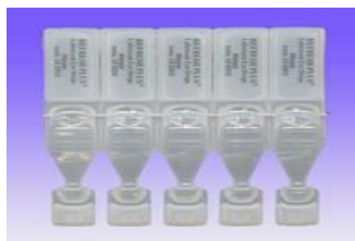
Uso de gota de lágrima artificial altavision.com.co