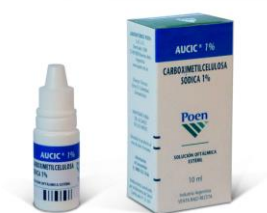
Gotas de Carboximetilcelulosa poen.net.ar