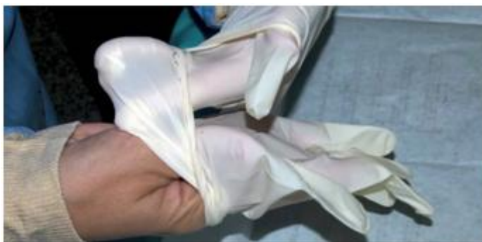
Imagen 7: colocación guantes quirúrgicos.

parte invertida (cara externa) del guante izquierdo, y se introducirá la mano con la ayuda de los dedos, estirando completamente el guante tapando parte