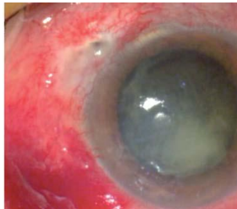
Imagen 1: endoftalmitis postquirúrgica por estreptococo. Se observa punto filtrante. 2