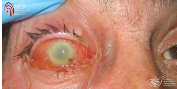
Imagen 2: endoftalmitis postraumática de dos días de evolución. 9

Es una complicación poco frecuente pero muy grave. Tiene una incidencia entre un 1-17%. Si el traumatismo se originara en un medio rural, la incidencia aumentaría a un 30%. El pronóstico visual se verá afectado