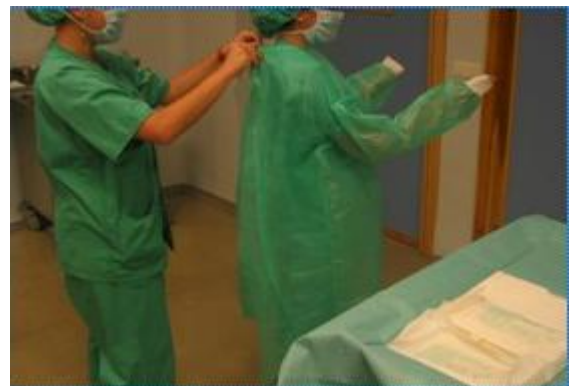
Imagen 6: colocación bata quirúrgica.