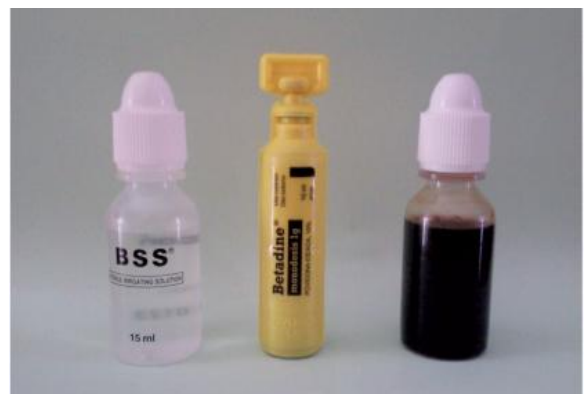
Imagen 4: betadine al 5% 5