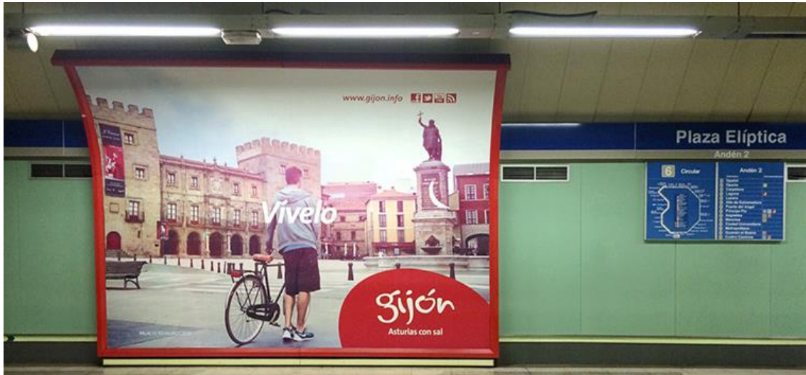
Img 6. Ejemplo de publicidad de Gijón como destino turístico en el Metro de Madrid.

grandes “ escaparates al exterior ” de la ciudad para dar a conocer la marca, a modo de ejemplo se menciona el Festival de Cine, o la programación de “ La Laboral, Ciudad de la Cultura ”.