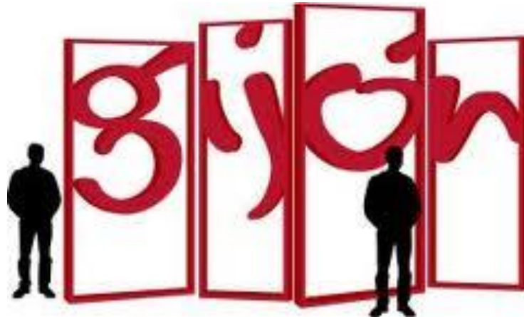
Img 4. Detalle del proyecto para la instalación de “Las Letronas” – Gijón.

aplicación de la marca en medios online, la campaña en medios de transporte público especialmente taxis, y la escultura de la marca en el puerto que se ha consolidado como un punto de interés fotográfico por los turistas. También se apunta que existe potencial de mejora en la asunción de la marca por algunas áreas de Ayuntamiento, en concreto el área de cultura, mientras que otras áreas han aprovechado todo su potencial, mencionando especialmente el área de deportes.