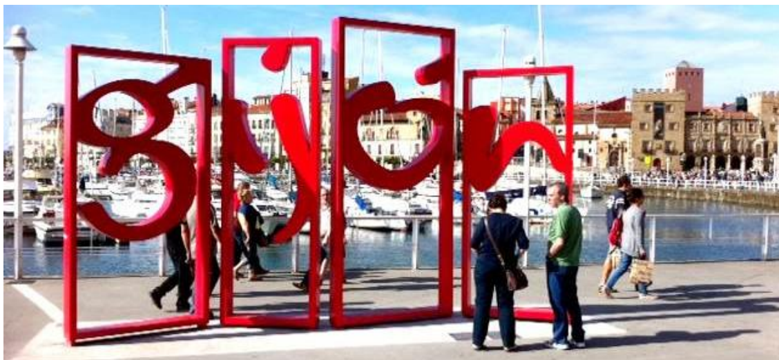
Img 5. “Las Letronas” – Puerto Deportivo de Gijón.

Desde la Sociedad Mixta de Turismo se cree que a la marca aún le falta un poco para consolidarse como marca ciudad, y que para ello se debe de activar la comunicación por parte de todas las áreas de Gobierno del Ayuntamiento, de tal manera que se aprovechen los