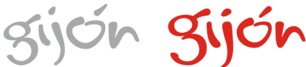
Img 7. Detalle del cambio de la marca Gijón antes y después de su rediseño.

Tal y como se explica en el propio manual de identidad gráfica disponible en la web del Ayuntamiento de la ciudad, el principal problema se detectó en los elementos que componían el logotipo. Los glifos carecían de alineación en altura, pesos, tamaño y equilibrio de los mismos. Los bordes necesitaban un suavizado en las aristas, lo que generó un cambio directo en el grosor. La mejora realizada por “Corsovia” optimiza los elementos pre-existentes sin alterar la esencia creada desde un inicio por CIAC, que sí era correcta por los atributos que desprendía. Es decir, es un rediseño pero reconocible, únicamente mejorado de cara a las piezas que pudiesen surgir. Se trata por tanto de una mejora y no un restyling de marca.