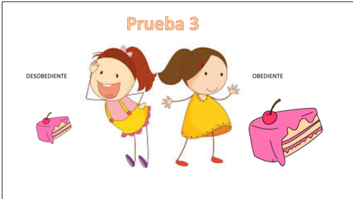
Figura 3: Imagen utilizada para la prueba 3 (Elaboración propia)

Todas las entrevistas han sido grabadas en audio, bajo el consentimiento del centro en el que se han realizado. Este instrumento nos permite analizar sus respuestas en otros momentos y más detenidamente.