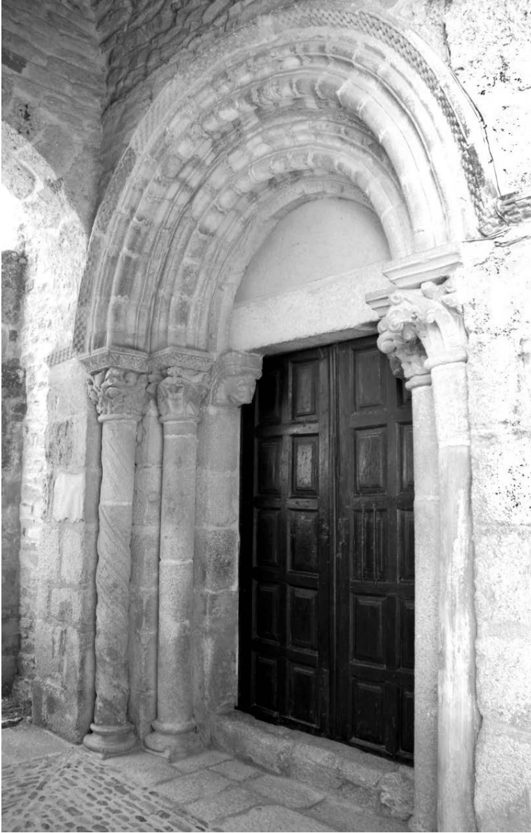
Fig. 1.- Puerta de la iglesia de San Esteban. San Esteban de Corullón (León).

NOT, J., Les débuts de la sculpture romane dans le Sud-Ouest de la France , Paris, 1987; DURLIAT, M., La Sculpture romane de la route de Saint-Jacques. De Conques à Compostelle , Mont-de-Marsan, 1990; LACOSTE, J., Les maîtres de la sculpture romane dans l'Espagne du pèlerinage à Compostelle , Luçon-Bordeaux, 2006; CAZES, Q. y CAZES, D., Saint-Sernin de Toulouse. De Saturnin un chef d'oeuvre de l'art roman , Graulhet (Tarn), 2008. Para León, AA. VV., Real Colegiata de San Isidoro. Relicario de la Monarquía Leonesa , León, 2007; AA. VV., Alfonso VI y su legado , León, 2012.