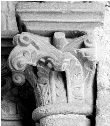
Fig. 7a. Capitel de la portada de San Esteban de Corullón.

Por lo que respecta a los capiteles de hojas caladas (fig. 7a), éstos se encuentran, de nuevo, en San Isidoro de León y en la catedral gallega, donde el ejemplar más antiguo podría ser el de la arquería oriental del transepto (fig. 7b).