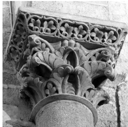
Fig. 7b. Capitel de la catedral de Santiago de Compostela.