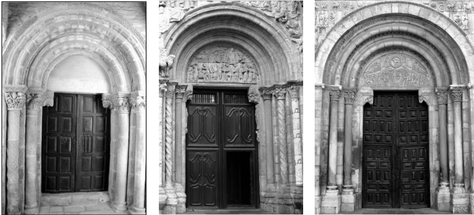
Fig. 3.- Puerta de San Esteban de Corullón, Puerta de Platerías en la catedral de Santiago de Compostela y Puerta del Cordero en San Isidoro de León.

En cuanto a los capiteles -analizados uno a uno desde el exterior izquierdo- encontramos, en primer lugar, una cestilla donde aparecen dos figuras desnudas, que hacen sonar sendas bocinas, aprisionadas por vástagos de vid entrelazados de los que cuelgan racimos.