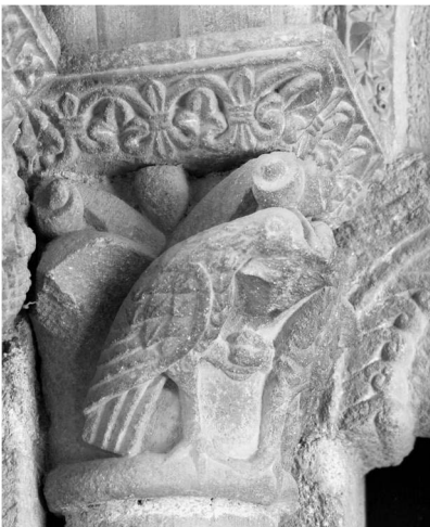
Fig. 5a. Capitel de la portada de San Esteban de Corullón.

En el capitel de las aves (fig. 5a), las plumas cortas cubren sólo una parte del cuerpo y de las alas, que se prolongan en plumas largas sobre la cola terminada abruptamente. Un modelo muy parecido se encuentra en varios capiteles de la girola de Santiago. Es característico de este grupo compostelano, que las aves picoteen algo y sus cabezas estén separadas por un elemento saliente, ya sea una concha o una penca. Además, en uno de ellos, la forma romboidal de las plumas cortas con los raquis bien marcados coincide con el ejemplar de Corullón 67 (fig. 5b).