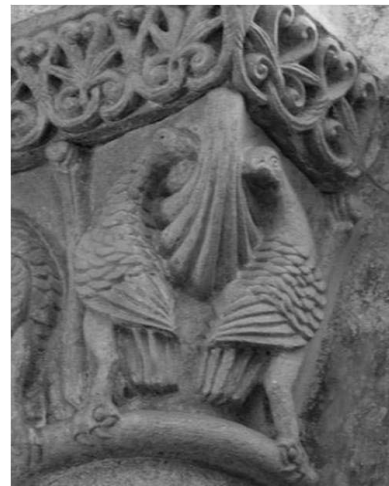
Fig. 5b. Capitel de la catedral de Santiago de Compostela.