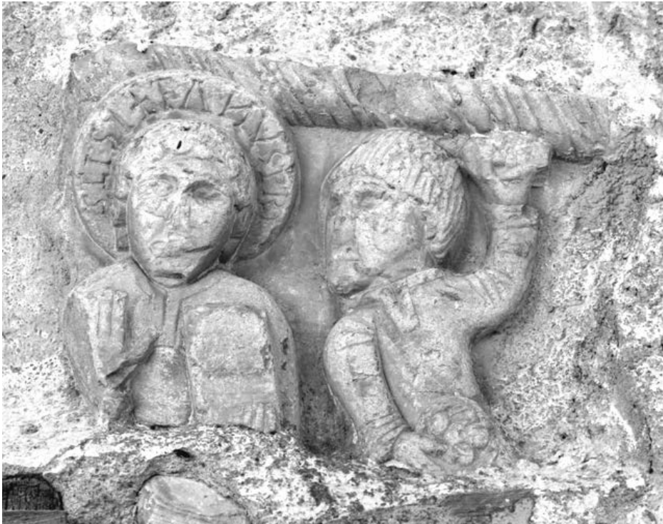
Fig. 2. Relieve de la Lapidación de San Esteban . Casa rectoral. San Esteban de Corullón (León).

Además de las fuentes epigráficas, contamos con algunos documentos medievales que pueden ayudarnos a completar la información sobre el edificio.