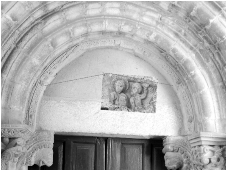
Fig. 8. Posible situación original del relieve de la Lapidación de San Esteban en el tímpano de la puerta de la iglesia.

No cabe duda de que esta obra pertenecía al templo, en el que ocuparía un lugar destacado, dada su temática. Allí la vio Quadrado, aunque entonces estaba ya apoyada en el suelo. Es posible que formara parte de la decoración de la puerta occidental (fig. 8). Hemos visto que el terremoto de Lisboa causó daños muy importantes en el edificio. Quizás uno de ellos fue el resquebrajamiento del tímpano, lo que obligaría a desmontarlo y sustituirlo. El tamaño de las figuras nos permite considerar esta posibilidad y, además, Gómez-Moreno aludió a la existencia de otro fragmento esculpido, en el que se representaba una especie de perro, que pudo formar parte de la escena 69 .