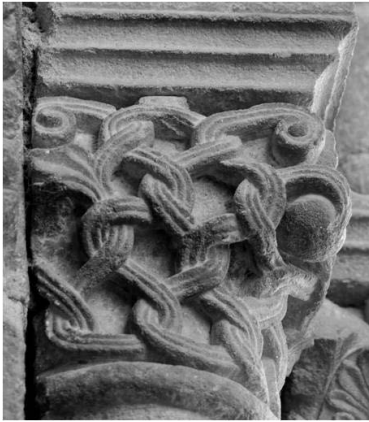
Fig. 6a. Capitel de la portada de San Esteban de Corullón.

Los capiteles con tallos entrelazados (fig. 6a) tienen una presencia notable en el templo de San Isidoro de León, en donde se advierte un trabajo de calado muy profundo que encuentra su referente de manera clara en Saint-Sernin de Toulouse 68 . Pero, la pieza más parecida a la de San Esteban, por su plasticidad, se encuentra en Compostela (fig. 6b), situada en el tramo de la girola que se abre al brazo sur del transepto y, por lo tanto, del periodo anterior al episcopado de Diego Gelmírez.