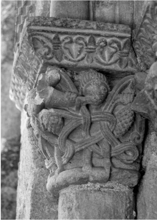
Fig. 4a. Capitel de la portada de San Esteban de Corullón.