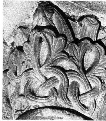
Fig. 6b. Capitel de la catedral de Santiago de Compostela.

Por lo que respecta a los capiteles de hojas caladas (fig. 7a), éstos se encuentran, de nuevo, en San Isidoro de León y en la catedral gallega, donde el ejemplar más antiguo podría ser el de la arquería oriental del transepto (fig. 7b).