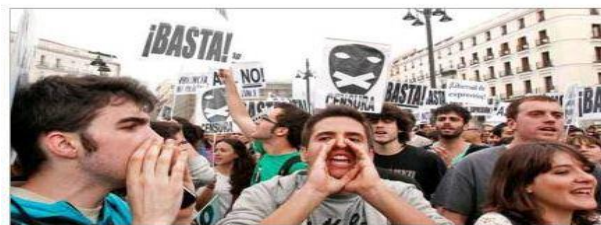
«Tenemos derecho a indignarnos». Miles de personas se reunieron anoche en la madrileña Puerta del Sol para protestar contra el sistema y los políticos. Convocados por SMS y Twitter, coreaban lemas como «democracia real ya, sin censuras» o «tenemos derecho a indignarnos».