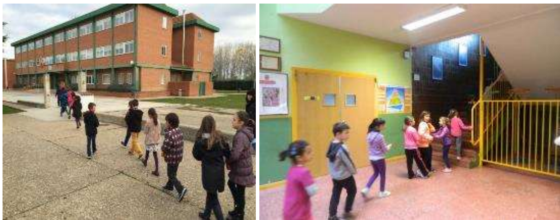
Foto 3: El patio del colegio pasa a ser un pasillo más, con reglas se tránsito