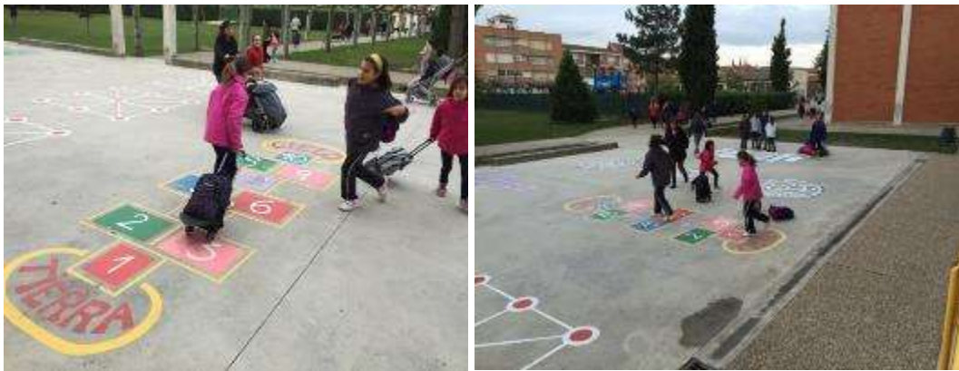
Foto 2: Niños/as jugando en el patio por la mañana antes de subir a clase