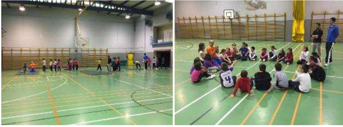
Foto 13: Pabellón polideportivo