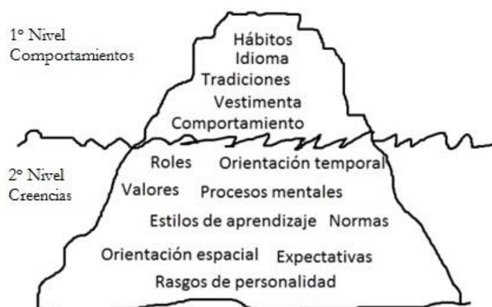
Figura 2: Adaptación de la metáfora del Iceberg Cummins (1986)

Si bien, como se muestra en el iceberg de Cummins (1986) los aspectos culturales observables -behaviours- son los más evidentes para los alumnos, pues se sitúan en la parte superior del iceberg que queda visible. El profesor es quien deberá acercar aquello que no podemos ver a simple vista, las -beliefs- y que se encuentra en la parte sumergida del iceberg y por lo tanto, no apreciable a simple vista. De esta forma la cultura quedará debidamente tratada. En la siguiente figura se muestra lo antedicho de forma visual: