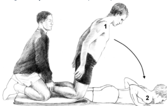
Imagen 2. Ejercicio nórdico para isquiotibiales

El ejercicio excéntrico más utilizado para la rehabilitación y prevención de las lesiones en la musculatura isquiotibial es el Nordic hamstring exercise (NHE) o el ejercicio nórdico para isquiotibiales. Este ejercicio es un ejercicio de carga natural en el que el deportista comienza en la posición de rodillas, y tiene que ir dejando caer el