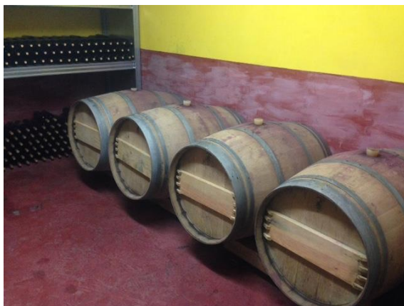
Fig. A.4. Sala de barricas y embotellado.