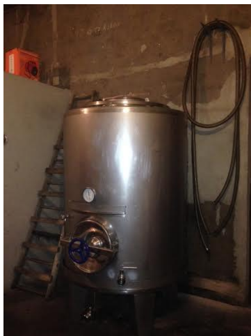
Fig. A.3. Sala de elaboración.