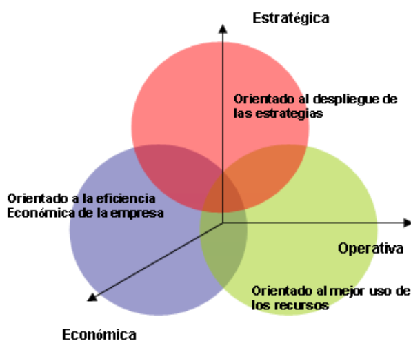
Fig. 2.2. Modelo de selección del mercado objetivo.

Al igual que antes en la búsqueda de estrategias de marketing, ahora deberemos analizar diferentes estrategias de segmentación. Para segmentar y acotar el mercado utilizaremos el modelo más común que es el modelo de Abell (1980).