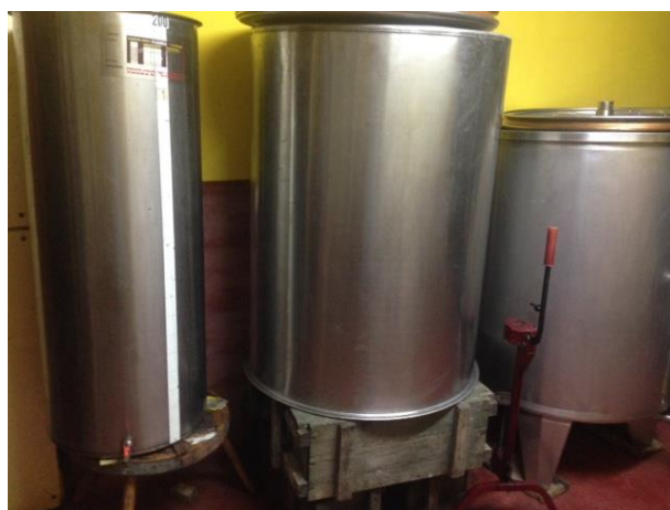
Fig. A.2. Sala de elaboración.