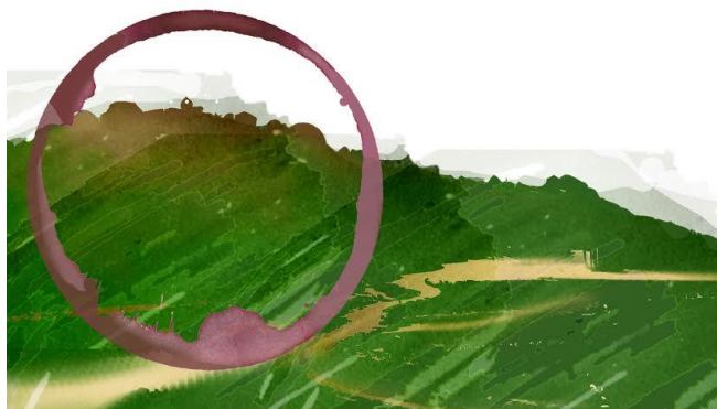
Fig. A.1. Diseño de logotipo para Bodegas la Asomadilla.