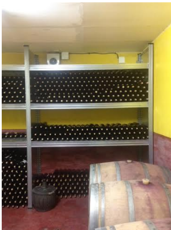
Fig. A.5. Sala de barricas y embotellado.