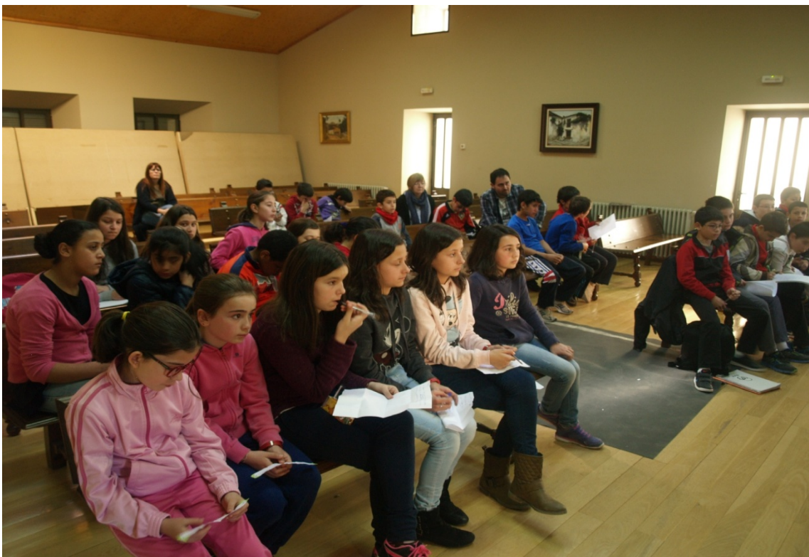
Figura 17: Los alumnos escuchando y apuntando las respuestas de la Alcaldesa.