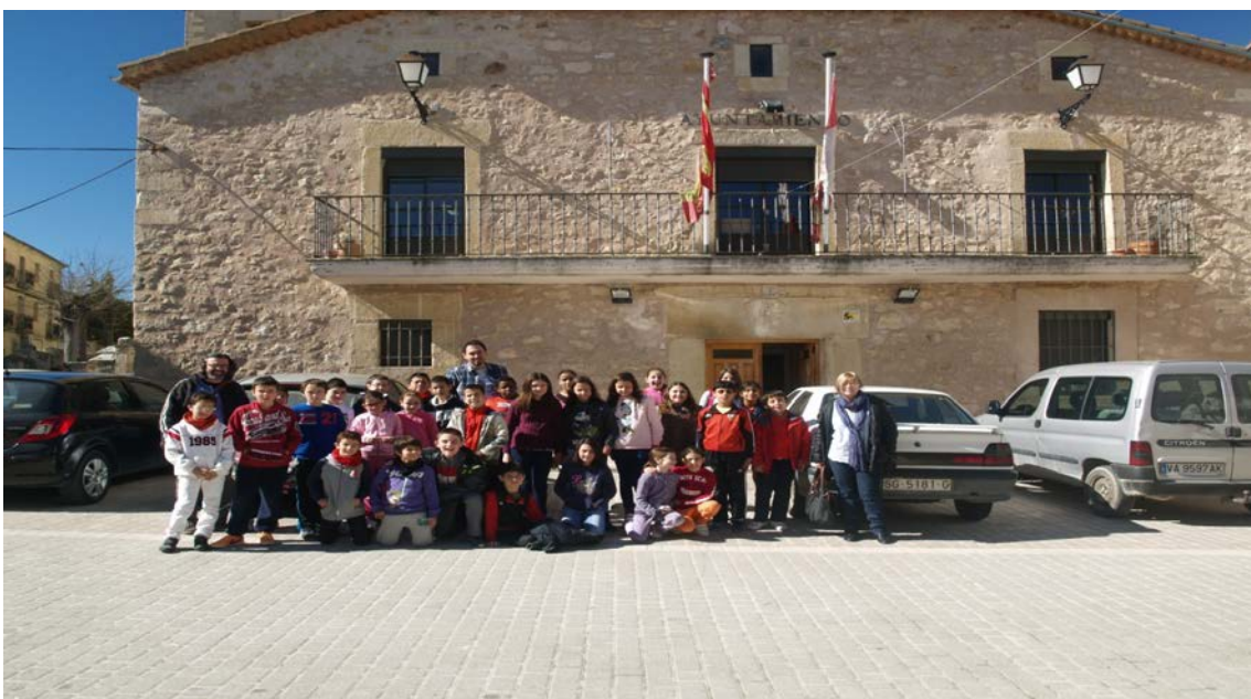
Figura 19: El grupo a la salida del ayuntamiento.

Finalmente, terminamos la visita con la foto final del grupo a la salida del ayuntamiento. Partimos de vuelta al colegio, con toda la información recabada y la ilusión de haber participado de las reglas democráticas de convivencia y ciudadanía.