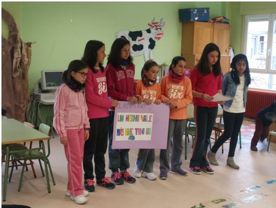
Figura 2: La agrupación electoral de Las Chicas.