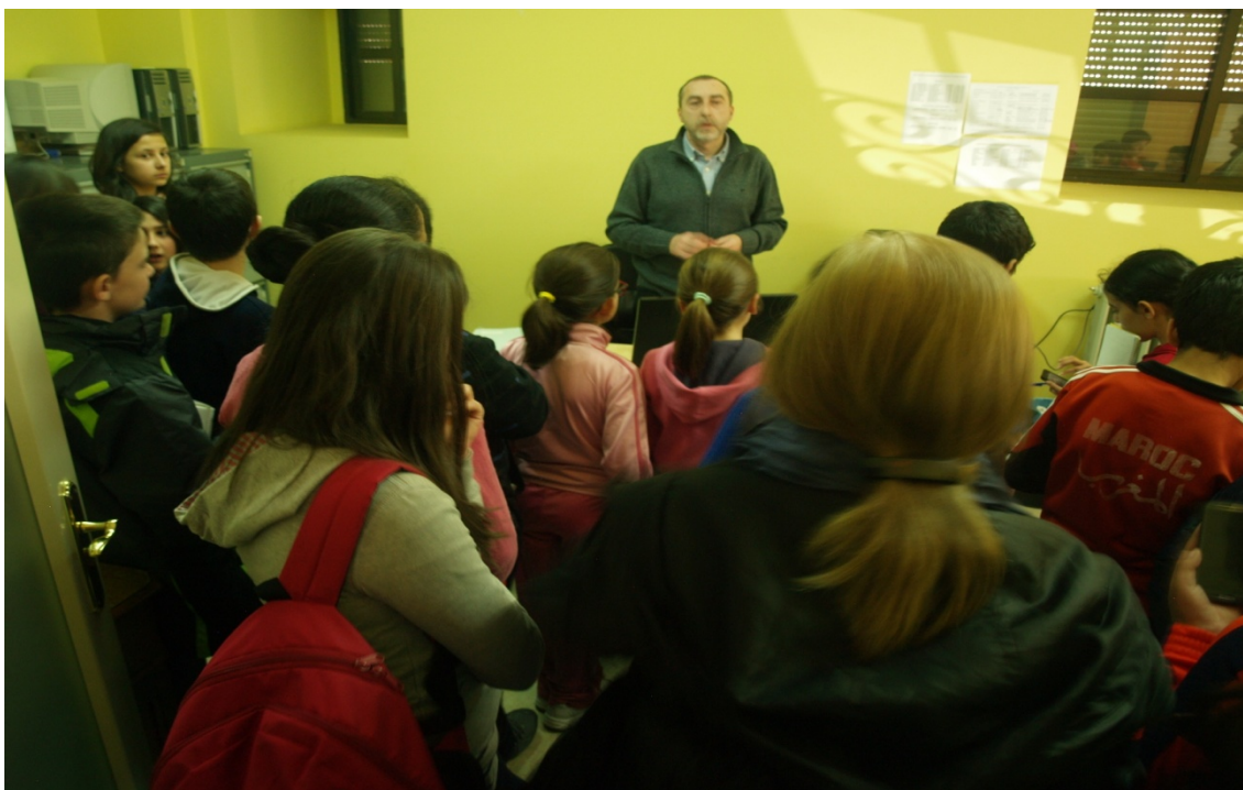
Figura 10: Despacho de la secretaría judicial.

Posteriormente subimos a la segunda planta.