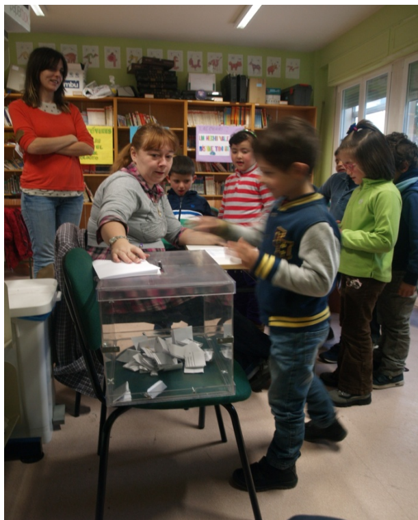
Figura 5: Los chicos y chicas de primero de primaria ejerciendo su derecho al voto.

La votación se realizó en la biblioteca del centro, durante las dos primeras horas de clase, fueron pasando todos los chicos y chicas del centro, así como los maestros y maestras. Todos votamos a la mejor representación del colegio.