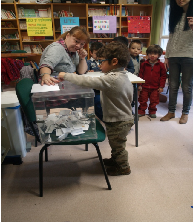
Figura 6: Los alumnos de infantil en el momento de la votación.