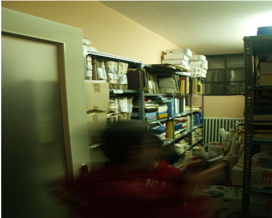
Figura 9: Entrada al archivo municipal.

que guarda los documentos y copias que llegan al ayuntamiento y las copias de los que salen del mismo. Es una habitación grande, bastante repleta, con estanterías y armarios, donde depositar los legajos de la historia administrativa del pueblo.