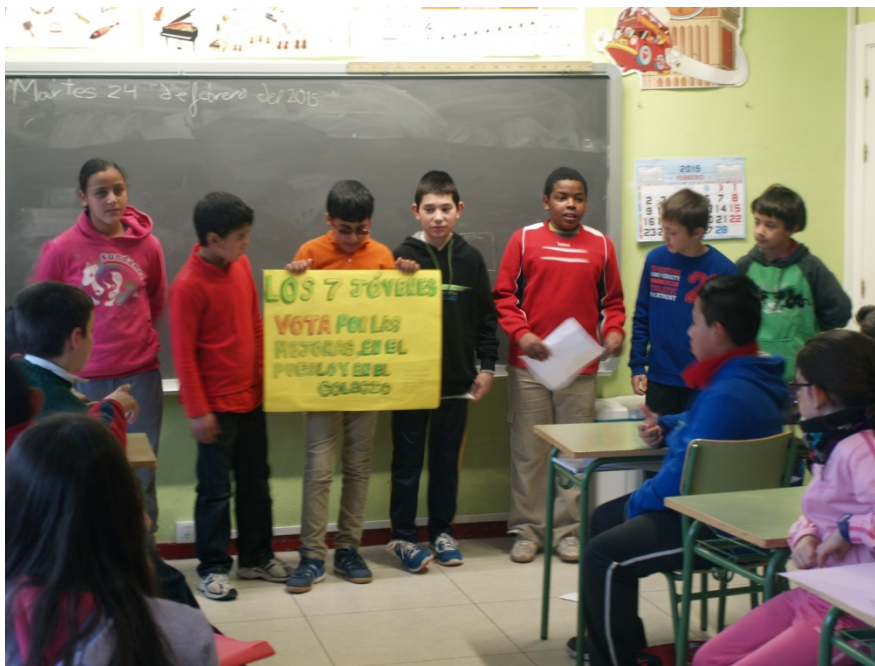
Figura 4, la agrupación electoral de Los siete jóvenes

Días después a las presentaciones por las distintas aulas, se realizó la votación para la elección del mejor programa de los cuatro. Cada alumno y profesor escribieron en papeletas en blanco el nombre de la agrupación elegida.