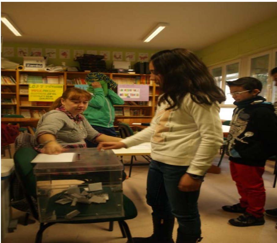
Figura 7: Las chicas y chicos de 6°.