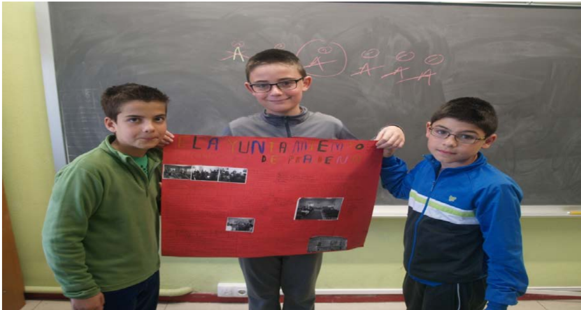
Figura 21: Otro grupo orgulloso de la tarea realizada.