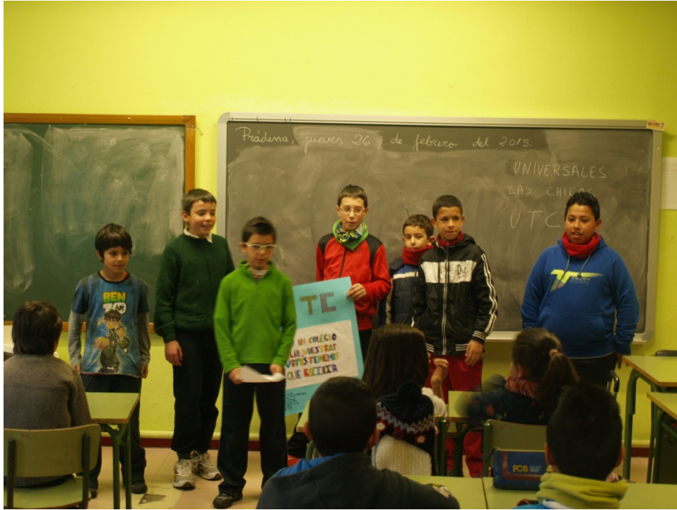
Figura 3, la agrupación electoral de La Unión de Todos los Chicos- UTC