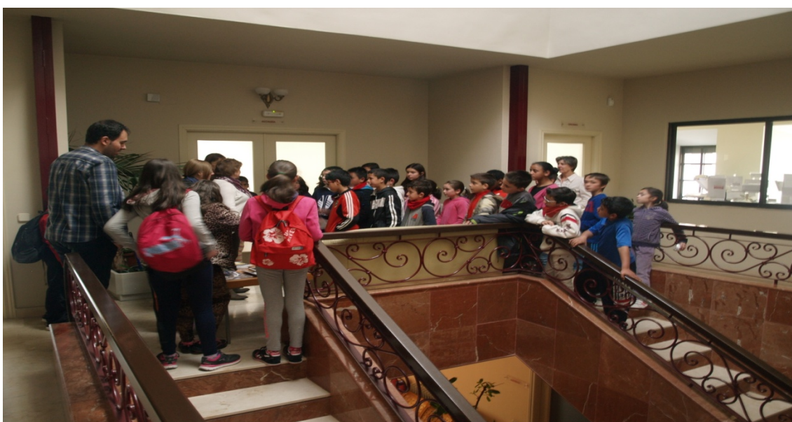
Figura 11: Las escaleras de subida al piso superior.

Posteriormente subimos a la segunda planta.