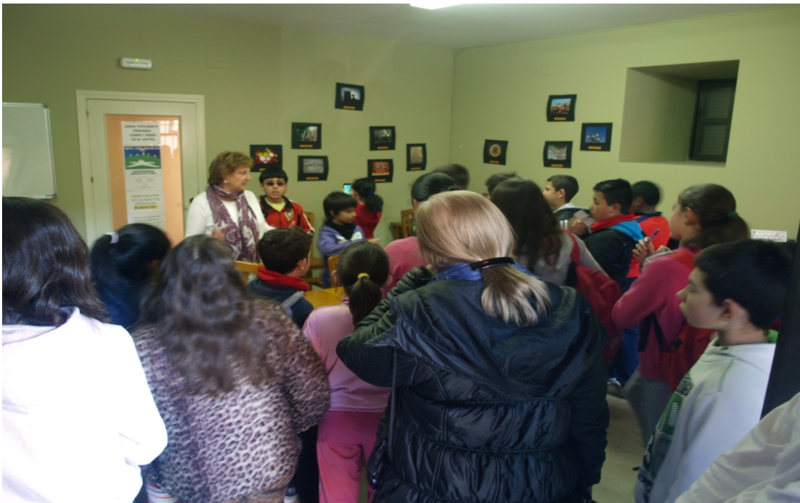
Figura 14: Aula del centro cultural.

Salimos al exterior para poder visitar otras dependencias municipales, como el centro cultural con acceso a internet para la ciudadanía del pueblo. Aquí se dan cursos de formación y capacitación a personas que lo requieran, de educación formal y no formal.