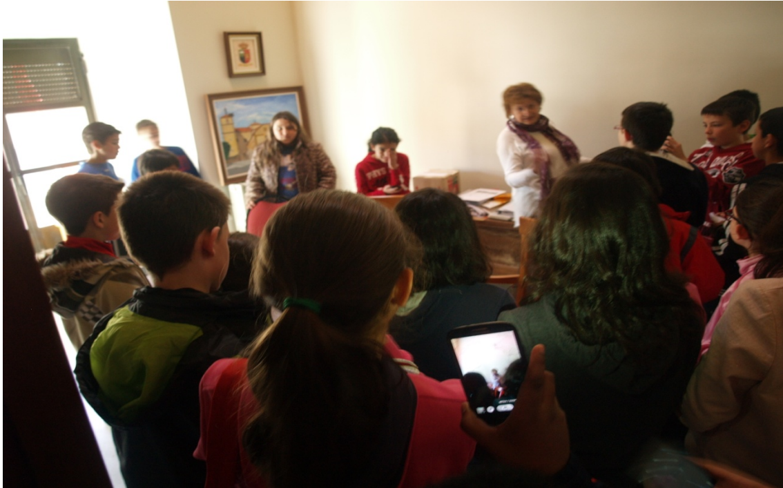
Figura 12: Visitamos el despacho de la Alcaldesa-Presidenta.

decisiones por las que se dirige el consistorio. Nos enseñan el despacho de la Alcaldesa, donde realiza su trabajo más personal.