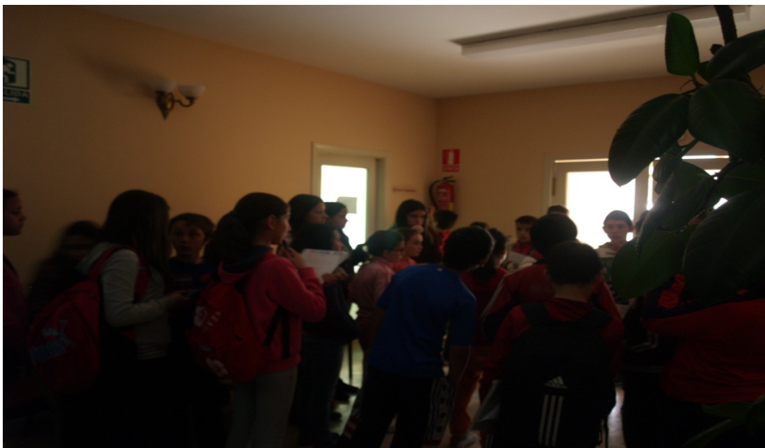
Figura 8: Entrada al edificio del ayuntamiento.

Posteriormente al recibimiento, la Alcaldesa, muy amablemente, junto con la concejala de educación, nos enseñan los distintos espacios del edificio y la función que desempeñan. A su vez, nos presenta a las personas que trabajan en el consistorio y charlamos con ellas, preguntando los alumnos el tipo de tarea que realizan, el tiempo que les lleva y sus diversas funciones en los cargos de responsabilidad que ostentan.