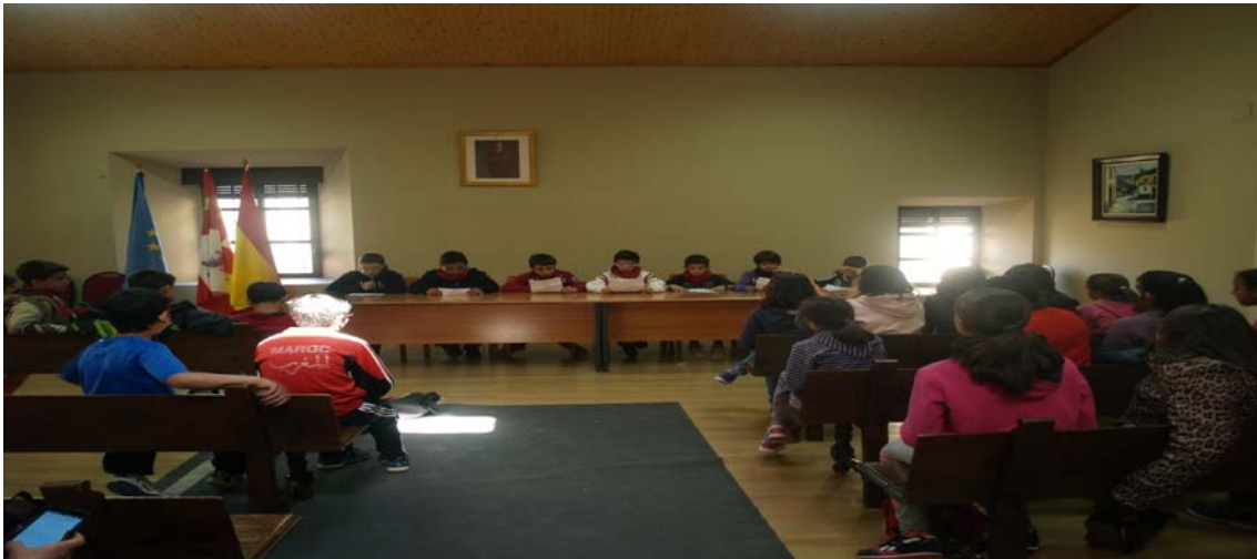
Figura 18: Desarrollo del pleno municipal infantil.

Al final de la entrevista, se desarrolló el pleno infantil con las propuestas y el programa de la agrupación elegida (UTC), que la Alcaldesa escuchó. Los chicos leyeron su programa desde la tribuna de gobierno municipal y todos los presentes aplaudimos con generosidad. Lástima que no se pudo llevar a cabo el debate posterior, ya que la visita se alargó más de lo programado y la Alcaldesa no disponía de más tiempo.