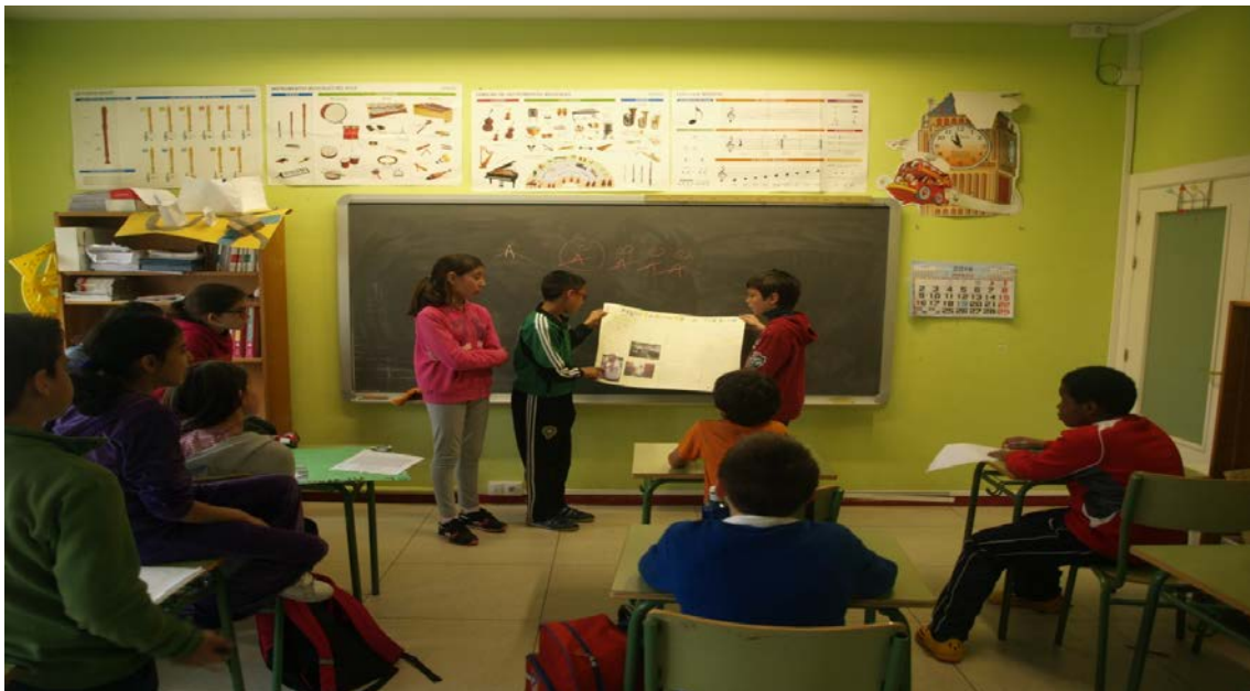
Figura 20: Uno de los grupos presentando el trabajo.

Durante esa semana, trabajamos en la confección de la lámina, preparando a su vez su presentación al grupo. A la siguiente semana se realizan las presentaciones, dando por acabada la actividad.