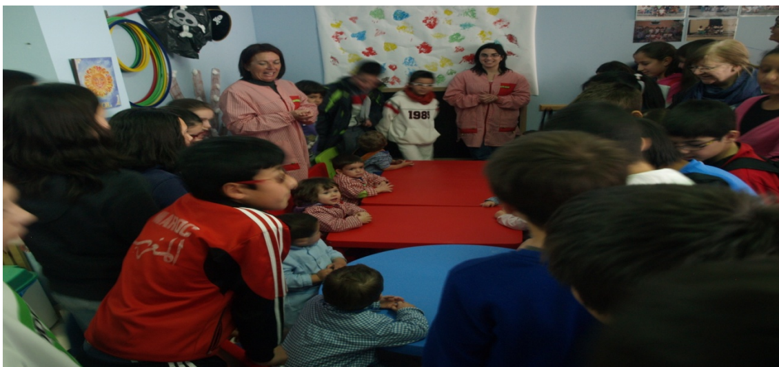
Figura 15: En la escuela municipal infantil.

Por último, subimos al salón de plenos donde la Alcaldesa nos contestó amablemente a las cuestiones que le reclamaron los alumnos. Incluyo algunas de las preguntas que le hicieron los chicos y chicas a modo de ejemplo: