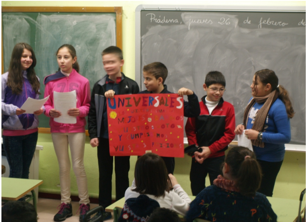
Figura 1: La agrupación electoral de Los Universales, presentando su programa electoral con su logotipo publicitario a los compañeros del centro.