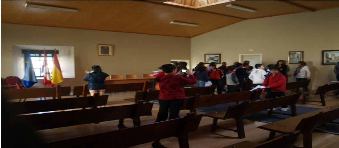
Figura 13: Salón de plenos municipal.

Salimos al exterior para poder visitar otras dependencias municipales, como el centro cultural con acceso a internet para la ciudadanía del pueblo. Aquí se dan cursos de formación y capacitación a personas que lo requieran, de educación formal y no formal.