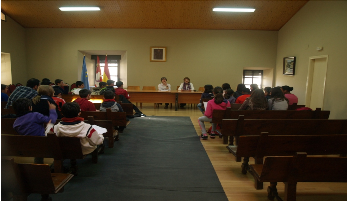
Figura 16: Los alumnos preguntando a la Alcaldesa en el salón de plenos municipal.