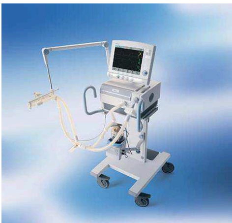
Imagen 1: Ventilador