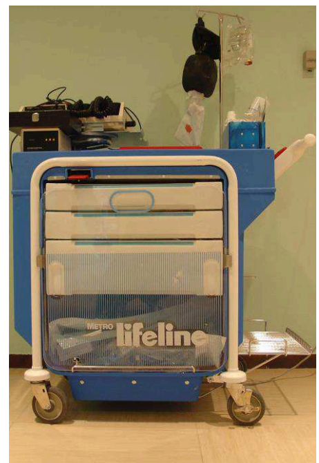
Imagen 3: Carro de paradas