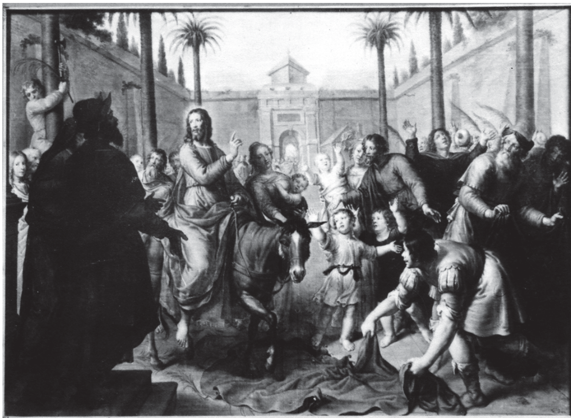
Fig. 5. Entrada de Jesús en Jerusalén . Pieter Van Lint. Bayerische Staatsgemäldesammlungen . Munich (Alemania).

Ya hemos adelantado la fecunda importación de pinturas flamencas a España. Las pinturas de van Lint debieron de llegar por la vía comercial del norte y del sur 10 . No obstante, las dos versiones que hemos estudiado aquí no proceden de España, pero coinciden los temas representados. No es aventurado catalogarlas en los últimos años de la producción del pintor que regresó de Italia entre 1640 y 1642 11 y murió en 1690. El comercio con España fue fecundo de 1665 a 1680. Los dos lienzos que tratamos podrían corresponder a este clima y época. El que hoy está en colección madrileña fue propiedad en el siglo XIX del coronel Woods, en Warnford Park, Hampshire (Reino Unido) 12 .