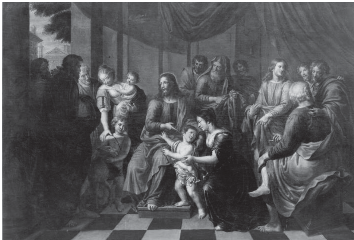
Fig. 4. Dejad que los niños se acerquen a mí . Pieter Van Lint. Sanatorium "Volière" . Lieja (Bélgica).

Tuve ocasión de restituir a Pieter van Lint una cuarta réplica (fig. 4) que se halla en el Sanatorium pour maladies mentales "Volière" de Lieja 7 , atribuida erróneamente a Jean Guillaume Carlier por Philippe y Borchgrave d'Altena 8 . Por entonces no se conocía ningún estudio de Pieter van Lint y su obra, salvo lo publicado en España sobre la importación desde Flandes en el siglo XVII 9 .