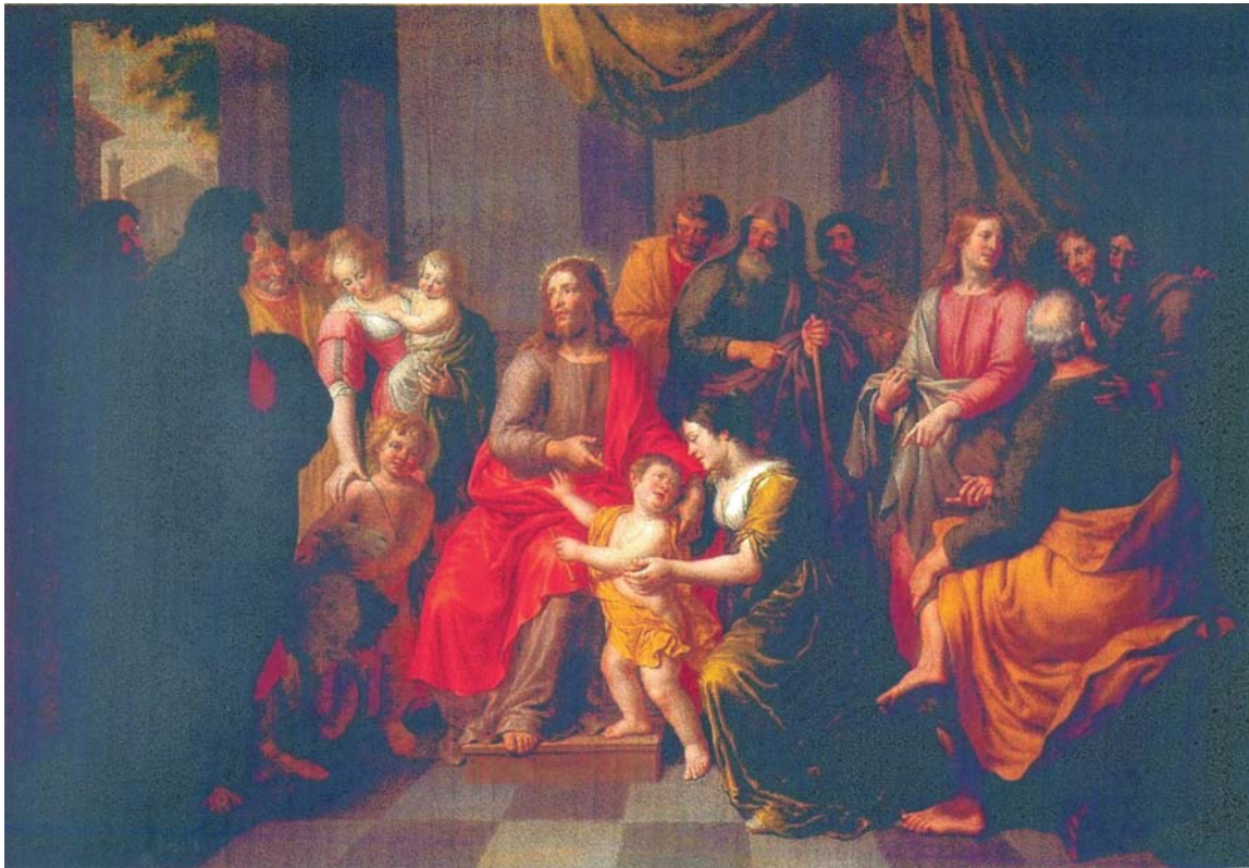
Fig. 1. Dejad que los niños se acerquen a mí . Van Lint. Colección privada. Madrid.

Dos lienzos pertenecientes a colecciones privadas de Madrid y Londres presentan la composición, técnica y estilo típicos de Van Lint. En ellos se narra la historia de Jesús recibiendo a los niños, Dejad que los niños se acerquen a mí , que constituyen modelo de varias réplicas y variantes. La réplica que está en España es la única que lleva la firma “P. Van Lint Ft”. Iconográficamente es un tema frecuente en la pintura del norte en siglos XVI y XVII. Todos los Evangelios relatan este encuentro salvo el de san Juan. (Mt 19, 13-15; Mc 10, 13-16; Lc 18, 15-18). Jesús deja que los niños se aproximen con sus madres a pesar de la oposición de sus discípulos. Igual que Jesús muestra sensibilidad por las mujeres, también la muestra con los niños. Es un episodio olvidado en la Edad Media, quizá por avivar ideales comprometidos con el celibato 4 . Esto está en la conciencia del protestantismo desde fines del XVI, lo que no fue obstáculo para Pieter Van Lint para difundir este episodio evangélico en los Países Bajos, sociedad más flexible que la errática de la Península Ibérica.