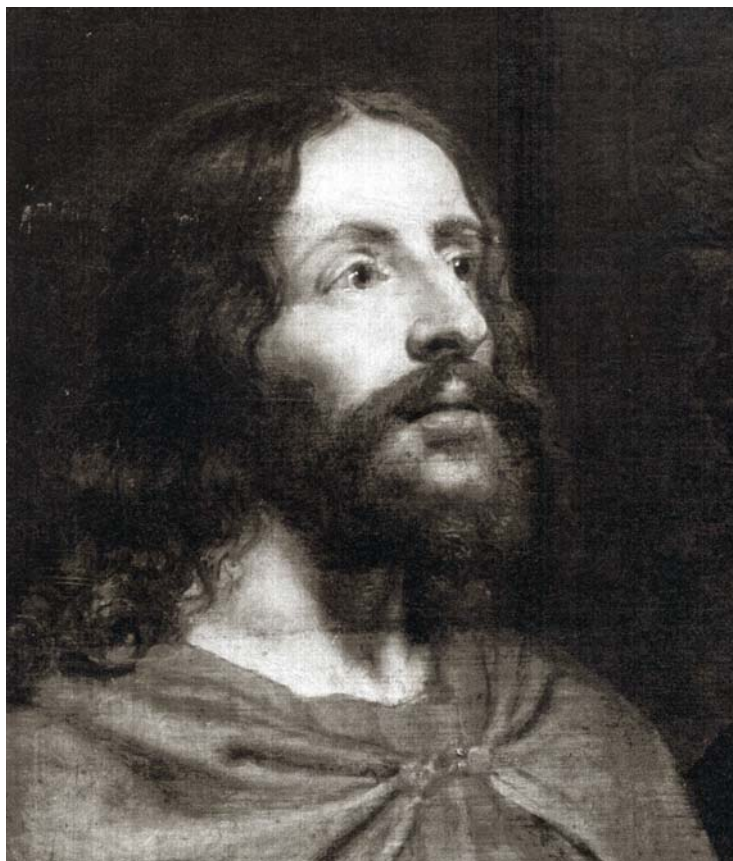
Fig. 3. Pieter van Lint. Busto de Jesucristo. Colección del conde de Bradford. Weston (Reino Unido).

estudios existentes sobre el pintor. Es el mismo rostro que conocemos a partir de la pintura conservada en la colección del conde de Bradford 5 (fig. 3). Un rostro de facciones correctas, que mira en éxtasis sublime al cielo, en trance y contacto directo con la divinidad.