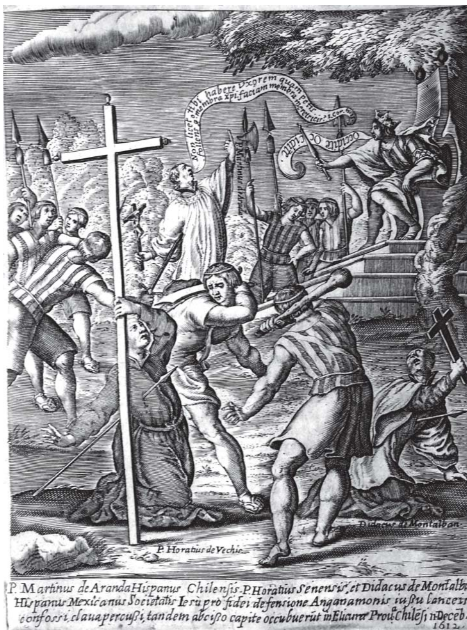
Fig. 7. Martirio de los misioneros.

marcan un hito en la iconografía de los tormentos y sacrificios de los evangelizados cristianos. Las fuentes italianas son una clara referencia para la creación iconográfica de los grabados de Histórica Relación ; en este sentido, el tema de la cruz como uno de los ejes principales de la composición era tema recurrente en las estampas librescas de la segunda mitad del siglo XVI. En las imágenes del Theatre des cruautés des hereticques de nostre temps (Amberes, 1588) y en el Tratatto degli instrumenti di martirio (Roma, 1591) de Antonio Gallonio -grabada por Antonio Tempesta- las escenas violentas de mártires sometidos a suplicios respondían, de forma ejemplar, a las necesidades y al sentimiento de la época; de este modo, se pronunciaba el cardenal Gabriele Paleotti: