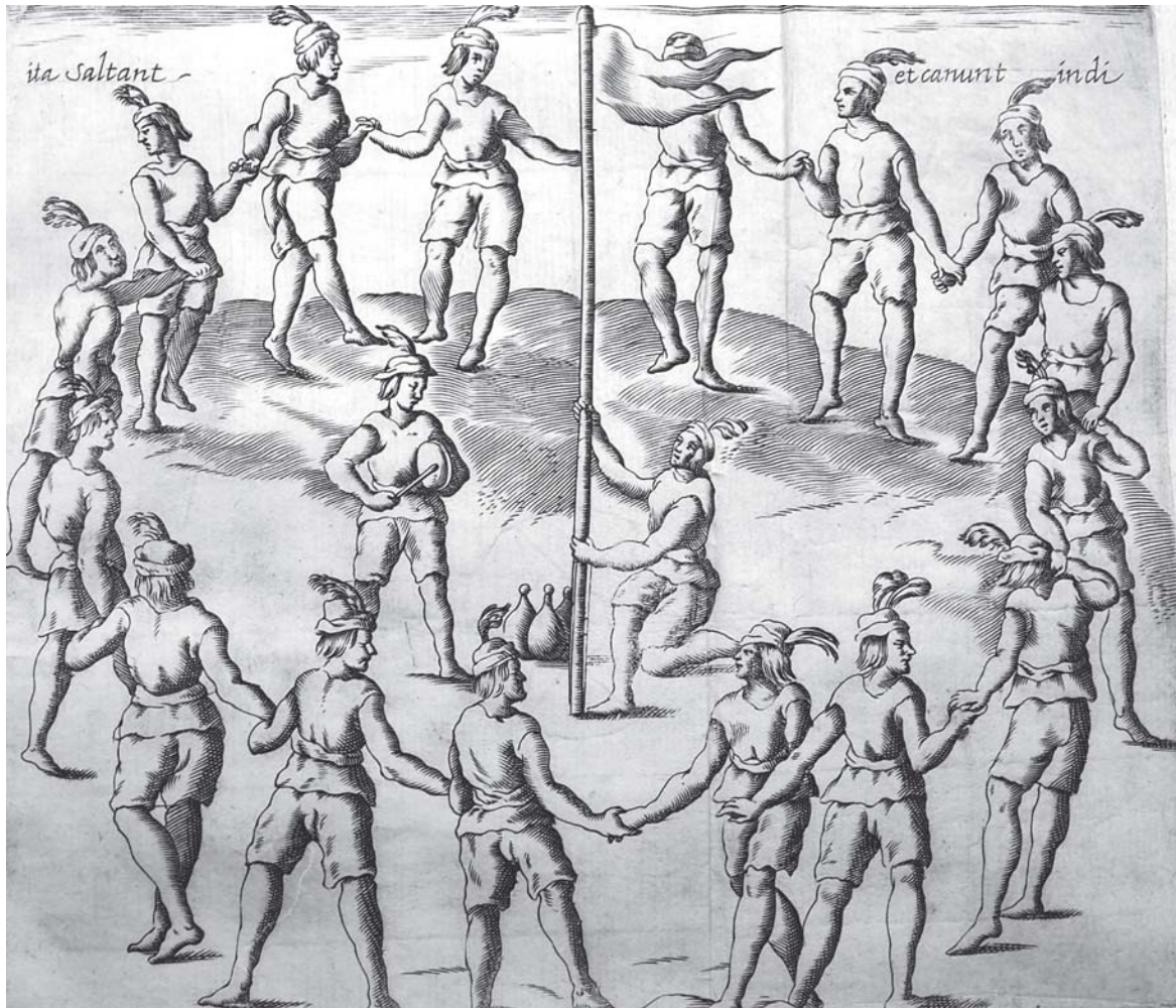
Fig. 4. Baile de los indios.

niendo una piedrecita, las cuales también van divididas de cinco en cinco, que en lengua de indio quiere decir quechu...” 58 .