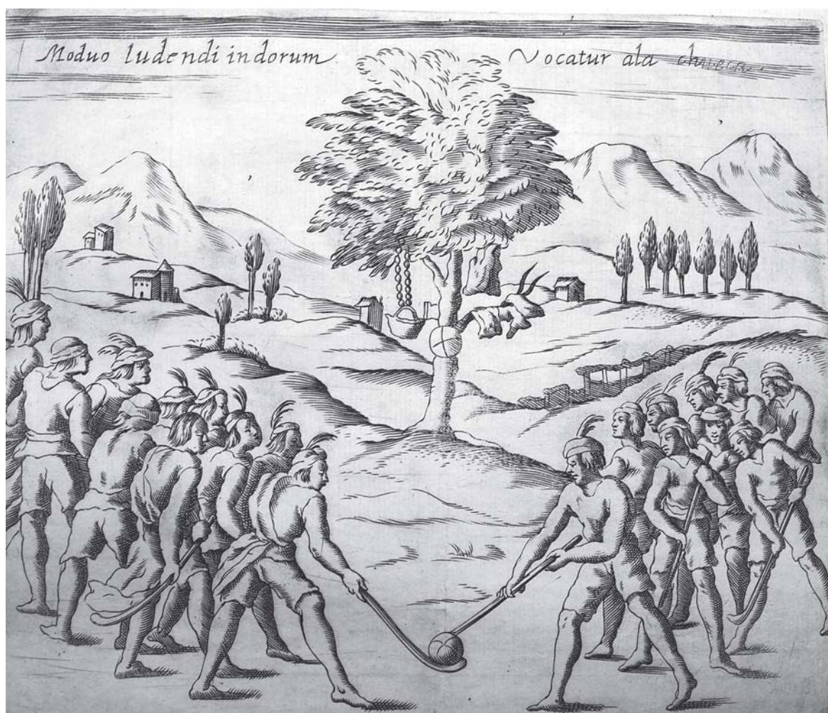
Fig. 5. Juego de la chueca.