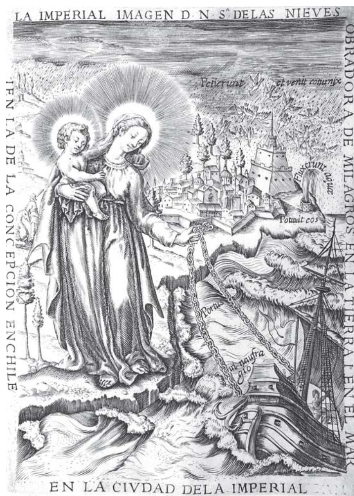
Fig. 2. La Virgen de las Nieves.

Santa María de las Nieves salva a los navegantes pero también libra a los españoles de una batalla echando tierra a sus adversarios (fig. 3) 49 .