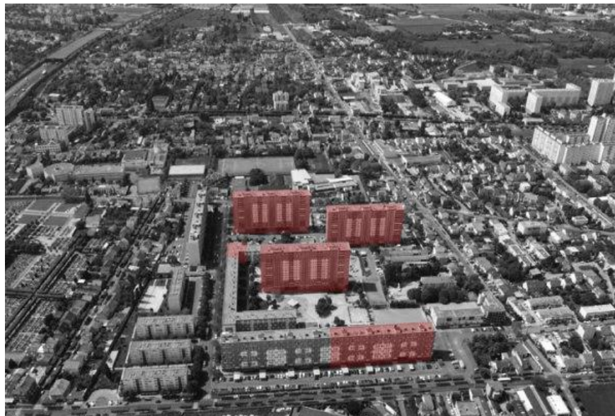
Fig. 1. Vista aérea y edificios demolidos de la antigua Cité Balzac.

Siendo las características físicas de los grands ensembles la principal excusa para la renovación, cabría cuestionarse la influencia del marco espacial en el modo de vida de sus habitantes. ¿De qué manera la relación con el espacio público de los vecinos influenciará la generalización de comportamientos incívicos en buena parte del parque social francés?