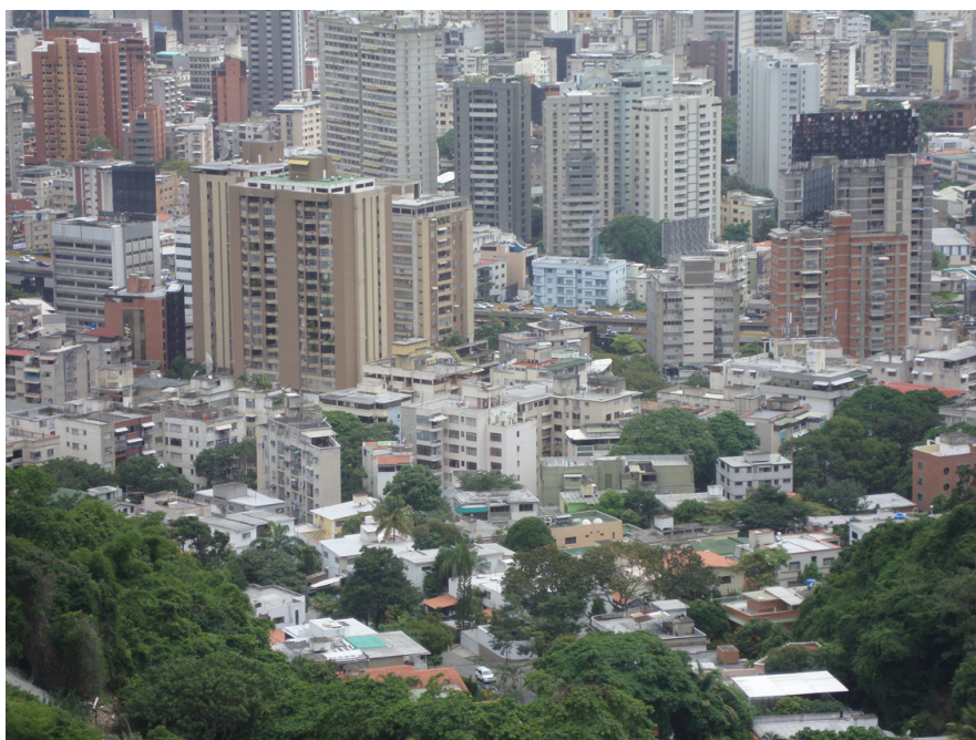
Fig. 5. Fenómeno “ciudad dentro de ciudad”. Sectores Chacaito-Chacao.

El siglo XX se cierra en medio de un panorama en profunda crisis, marcado por la dualidad entre la globalización y la pobreza (Cariola y Lacabana, 2001). En este contexto, el candidato presidencial Coronel Hugo Chávez, figura desligada de los grupos políticos tradicionales se impone con una mayoría absoluta en los comicios electorales del año 1998 (Banko, 2008). En su primer año de gestión (1999), se aprueba una nueva Constitución, fundamentada en el ejercicio de la democracia participativa y protagónica, que marca el inicio de un nuevo proceso de crecimiento y transformación de la ciudad.