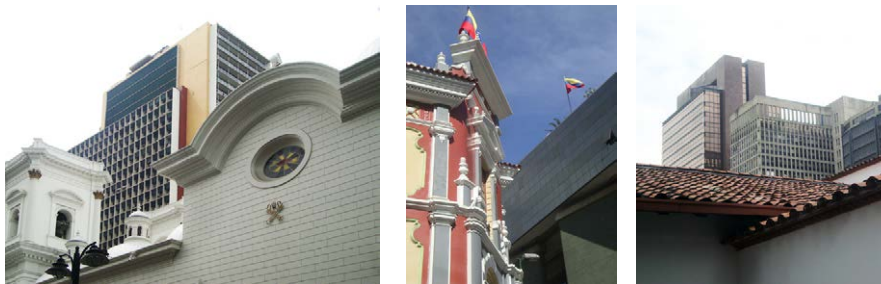
Fig. 3. Fenómeno “ciudad dentro de ciudad.” Contrastes entre fragmentos.

establecen unos circuitos de desplazamiento relativos a cada individuo, en virtud de su actividad o clase social de procedencia.