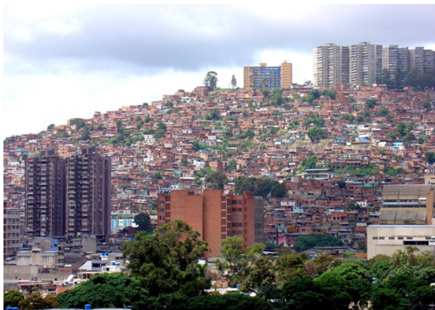
Fig. 4. La otra cara de la modernidad. Barrios en Propatria.

Se evidencia así, el otro lado de la modernidad. Se consolidan los barrios de ranchos en las periferias de la ciudad como parcelaciones ilegales, sin un proyecto conjunto, carentes de infraestructura sanitaria con un aspecto irregular, a pesar de su regularidad interna (Marcano, 1994). Además, surgen las casas de vecindad, que suelen encontrarse en el interior de las manzanas o en los edificios abandonados en el centro de la ciudad, que progresivamente se van deteriorando. A su vez, los planes iniciales del modelo moderno son incumplidos. Las parcelas se dividen porque su precio es muy elevado para un sólo promotor, las viviendas que se construyen tienen más pisos de los previstos inicialmente y los espacios verdes se reducen significativamente para rentabilizar el suelo.