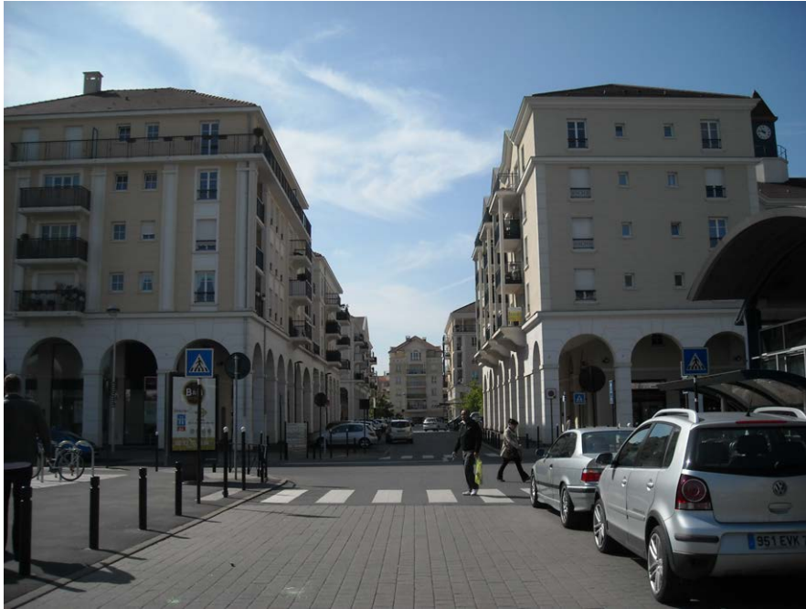
Fig. 6. Vue vers la place Sud, aujourd'hui, photo de l'auteur.