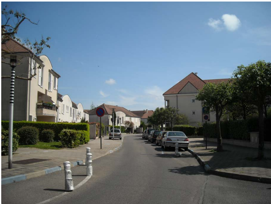
Fig. 7. Les quartier pavillonnaires aujourd'hui, photo de l'auteur.