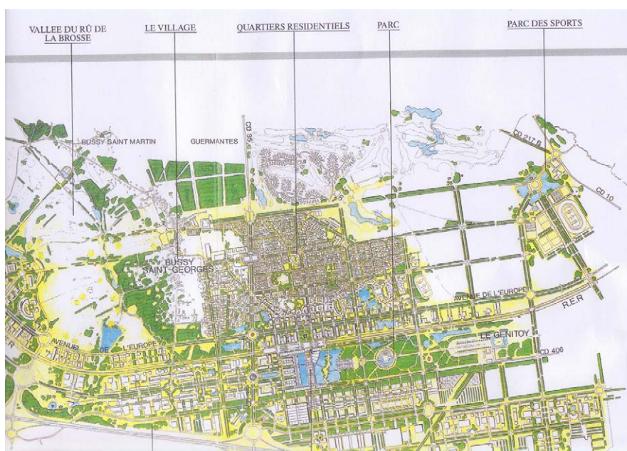
Fig. 1. Plan masse avec indication des équipements

De toute manière, ce n'est qu'à partir de la moitié des années quatre-vingt que l'EPAMarne multiplie ses efforts pour débloquer cette situation arrivée désormais à un grave retard, qui affecte par ailleurs aussi les deux autres secteurs, bien que sous d'autres formes.