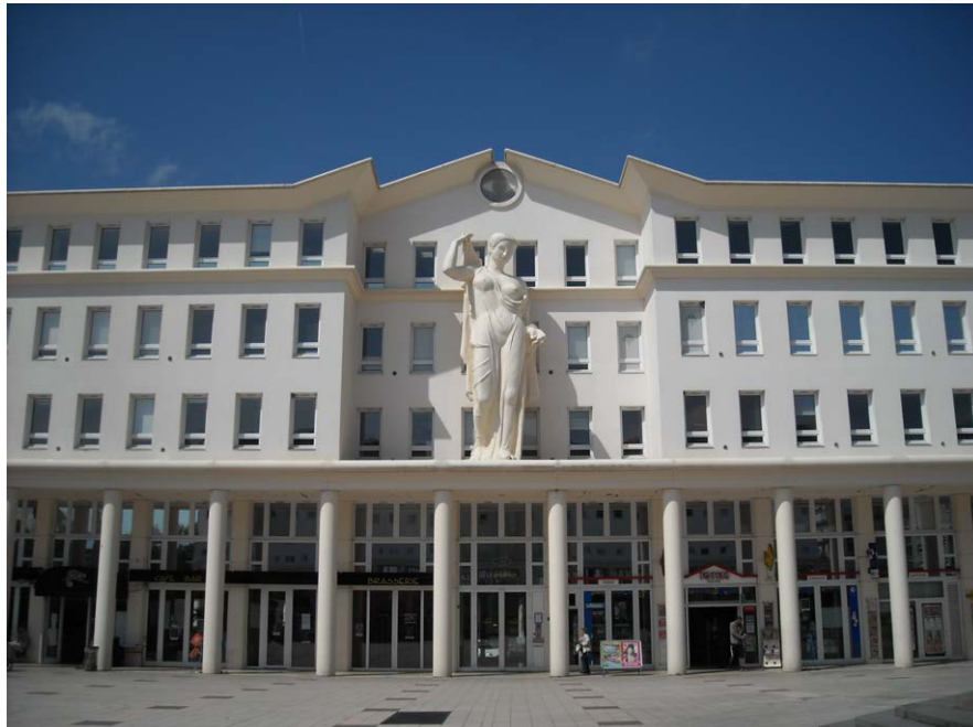
Fig. 4. Un des deux bâtiments symétriques de la grande place aujourd’hui.

Ils reconstituent parfois des ghettos. Car toutes les personnes ne décident pas –à priori– d’habiter dans certains quartiers. (...) Les habitants de la ville expriment leurs préférences. La ville évolue” 19 . Cette rhétorique de la liberté de choix des modes de vie est illustrée par une métaphore spatiale dans les concepts de polycentrisme: “Bussy Saint-Georges n’est pas en soi un centre urbain mais plusieurs centres. (...) C’est sur ce principe de fédération de centres de quartier que peut se constituer la vie attrayante de la cité. (...) Si l’ensemble est traité avec qualité, cohérence, transitions harmonieuses, on aboutira alors –et dans le détail– à la diversité recherchée” 20 .