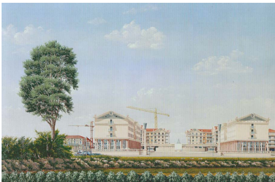
Fig. 3. Image à l'aquarelle commandée par l'EPA Marne pour représenter le projet de la Grand'Place Manolo Nunez en construction.

La centralité territoriale à l'échelle régionale se compose, dans le cadre des périmètres de communes déjà existantes qui constituent le premier acte de naissance d'une ville nouvelle, d'une série de centralités mineures, composées justement de secteurs. Dans le Val de Bussy était en effet prévu 18 :