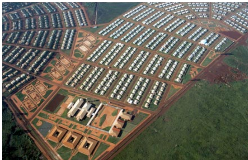
Fig. 4. La periferia urbana: vista aérea, una de las etapas de construcción del Complejo habitacional A-4.

La población que reside en el conjunto habitacional A-4 se ha venido caracterizando por familias con alto nivel de carencia y vulnerabilidad: grupos numerosos, bajos ingresos, nivel elevado de desocupación, etc. Actualmente los problemas de la economía doméstica están relacionados con la carencia e inestabilidad de ingresos monetarios. Relevamientos realizados en tiempos recientes señalan que el 42% de los “jefes de hogares” se encuentran en situación de desempleo 5 .