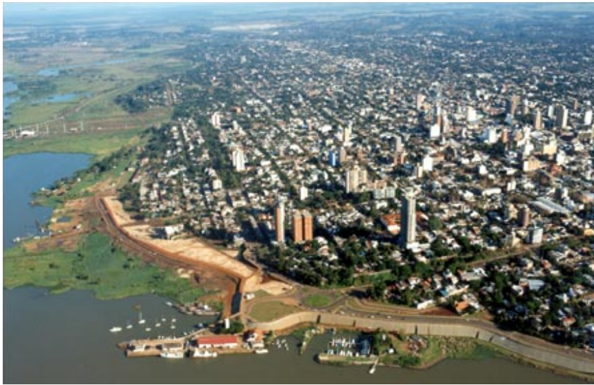
Fig. 2. Zona costera. Un tramo de la avenida Costanera.