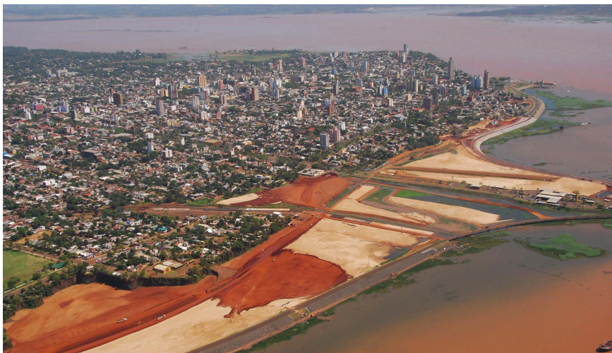
Fig. 3. Zona costera. Aumento del nivel de cota del río Paraná a la altura de la cabecera del puente internacional Posadas-Encarnación.

El proyecto Costanera como parte de las obras complementarias de Yacyretá, y las consecuentes relocalizaciones han tenido un efecto re-estructurador de la ciudad de Posadas. Los “bolsones de pobreza” ya no se localizan dispersos sobre el espacio urbano. El amplio margen al río Paraná, tradicionalmente ocupado por asentamientos precarios, se fue convirtiendo literalmente en “zonas liberada de la